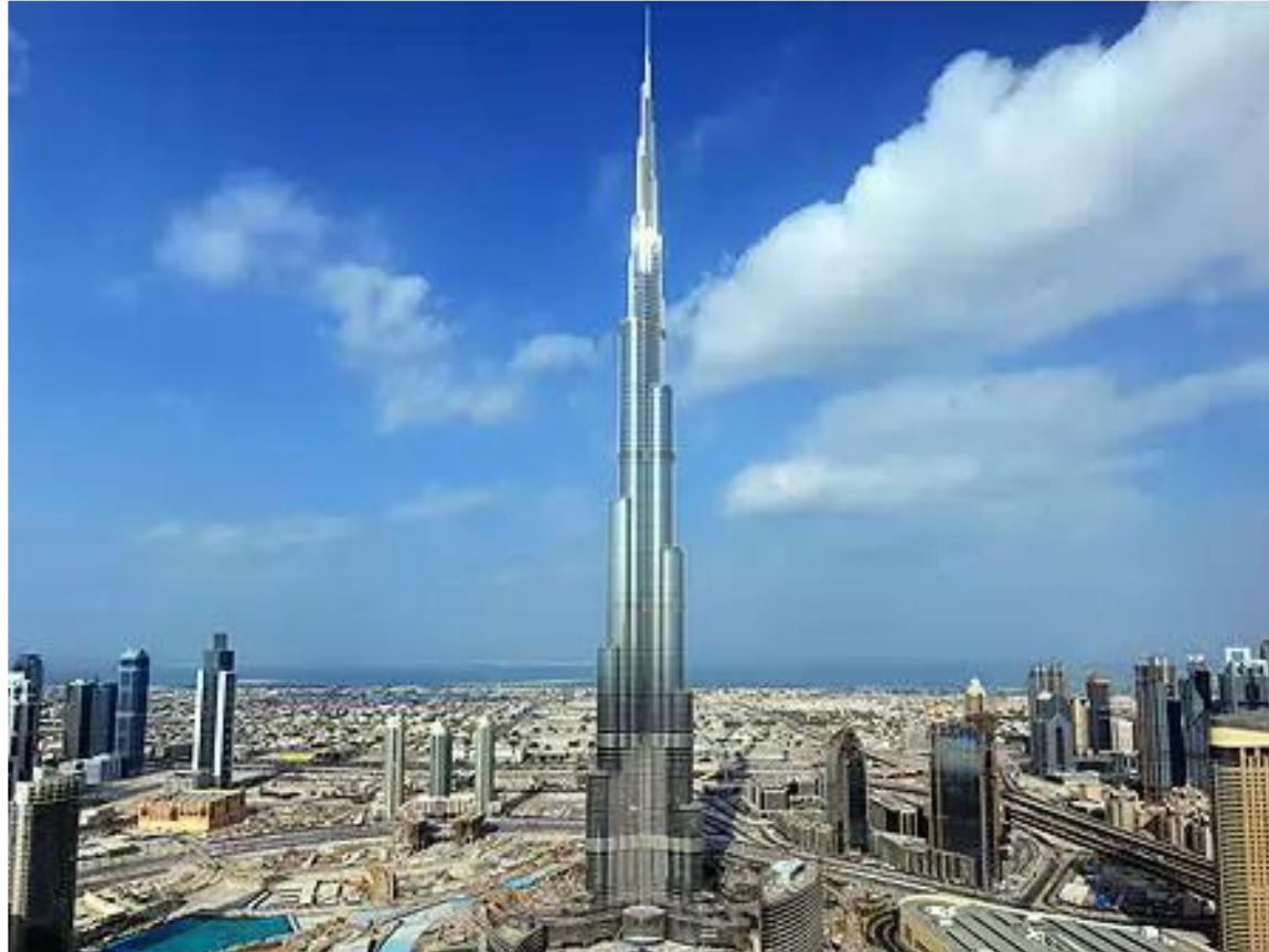
Небоскрёб в Дубае