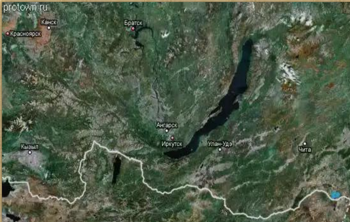
Озеро Байкал (Вид из космоса)