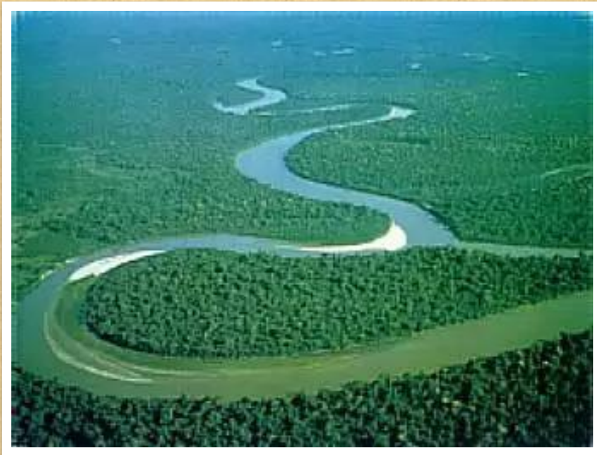
Великая река Амазонка