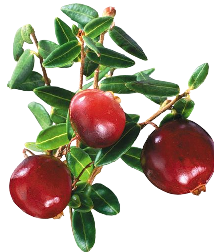
Клюква Е. Трутнева

Тоньше нитки стебелек- Чуть подрос и сразу лег. Собирай в корзинки Клюкву – ягоду с перинки.