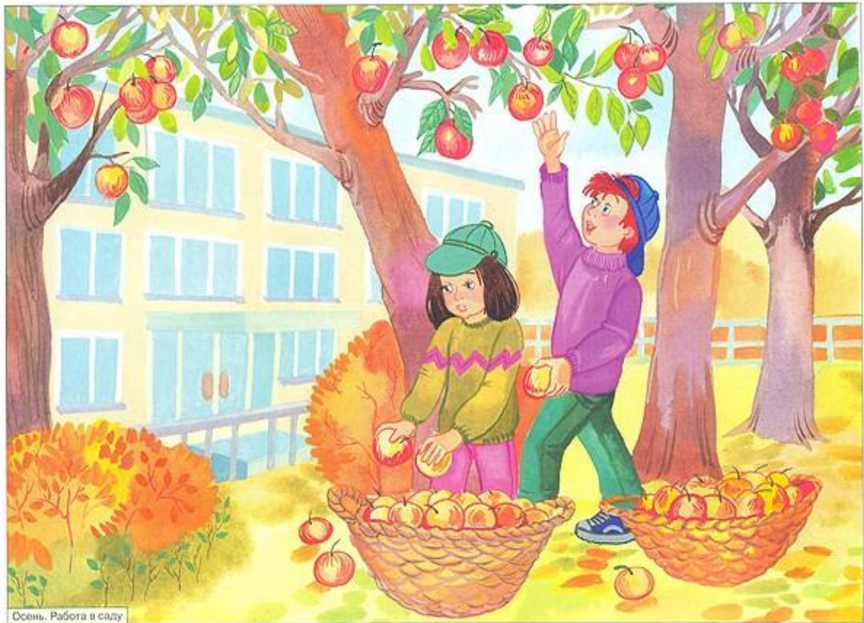
Осень. Работа в саду