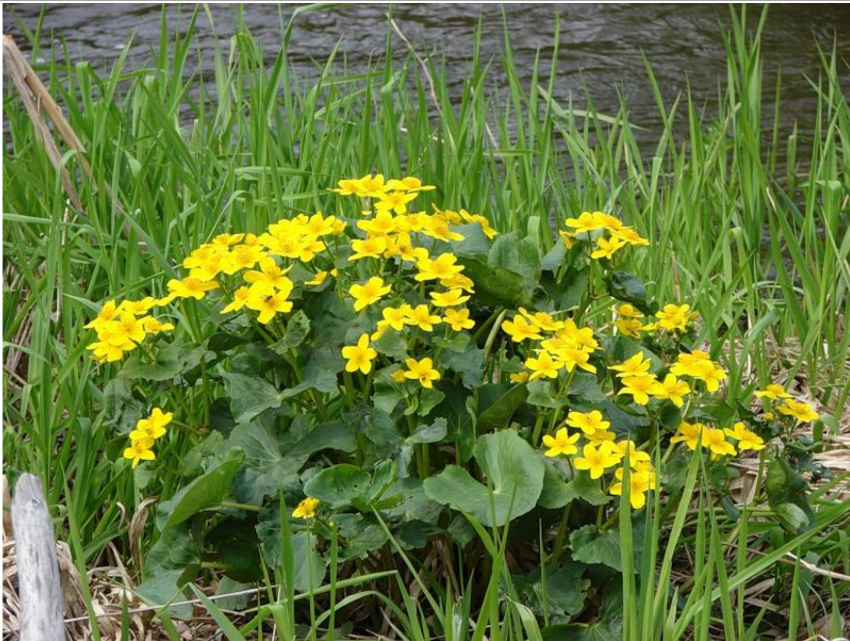
У воды цветет калужница