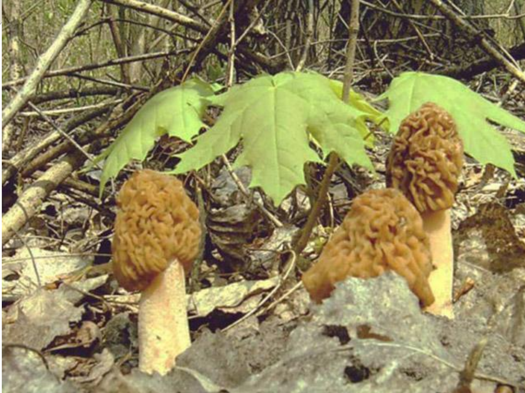
Появились весенние грибы сморчки