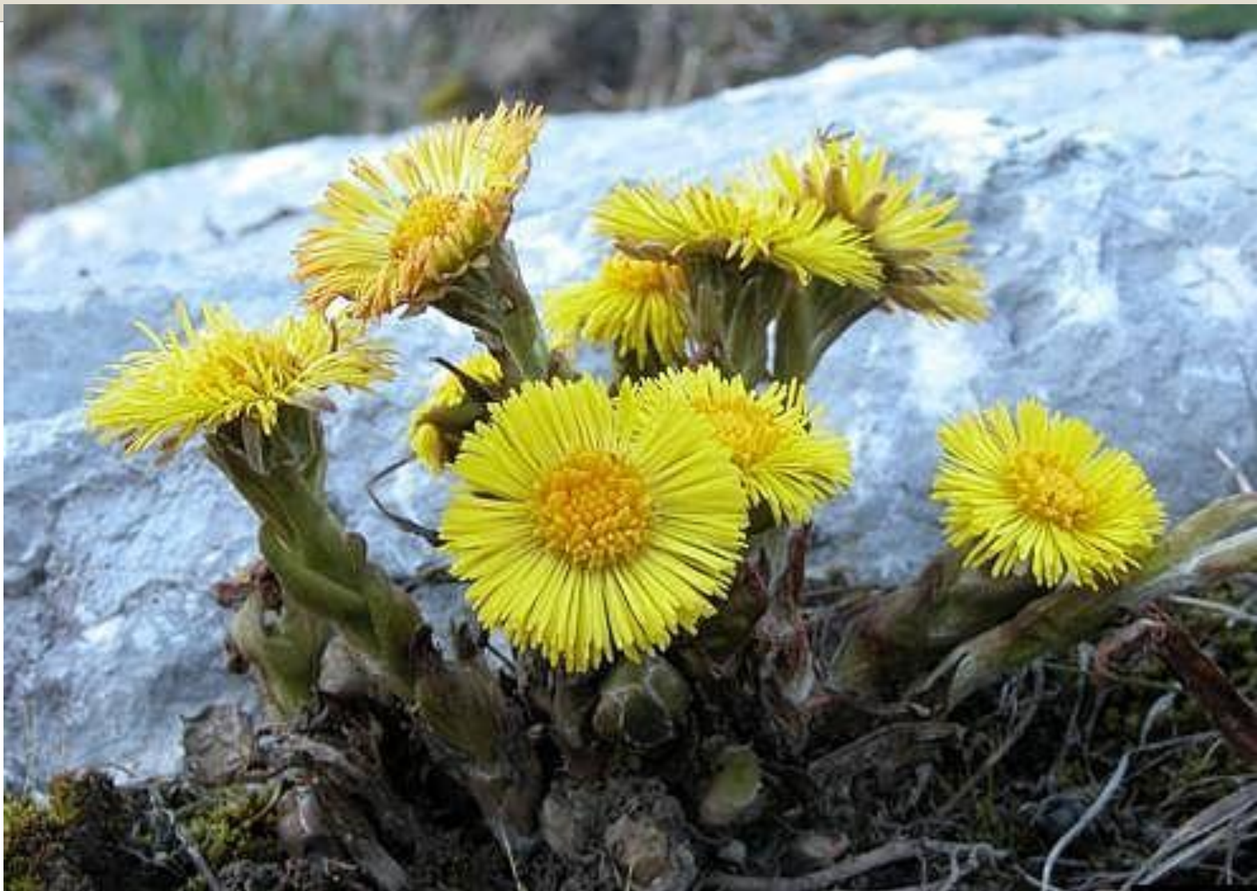
Расцвела на проталинах мать-и-мачеха.