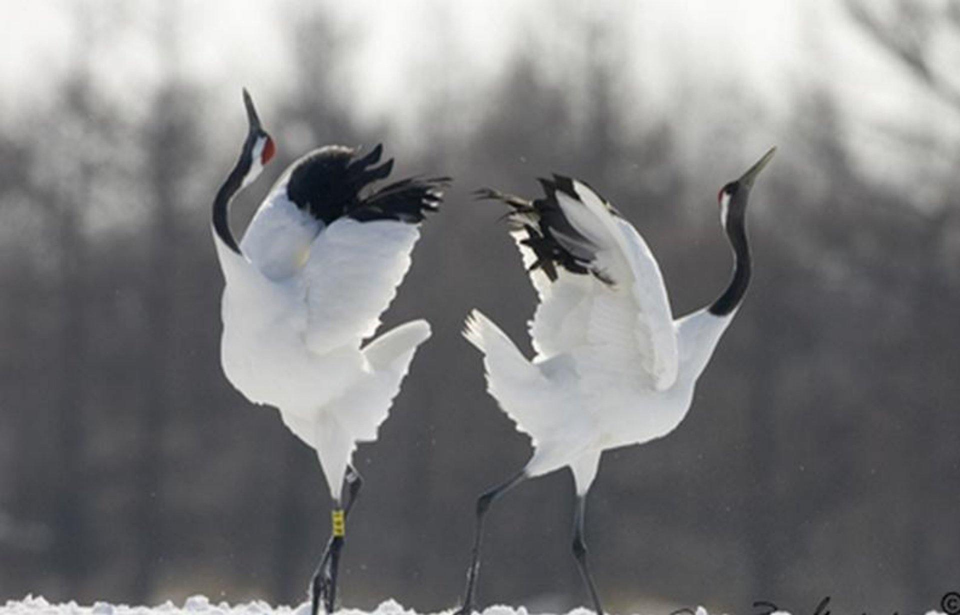
Журавли танцуют на болоте