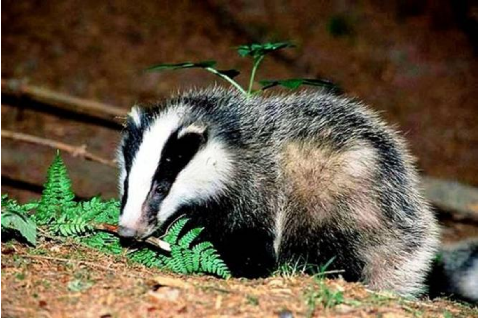
После зимней спячки проснулся барсук