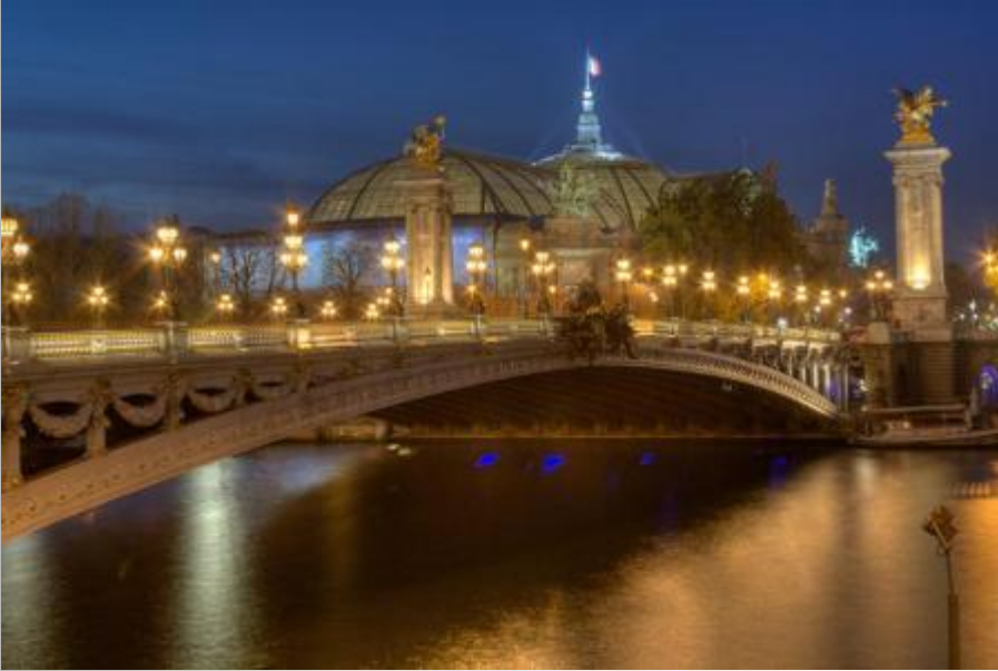
Мост Александра III

По краям моста на высоких колоннах золотые крылатые кони