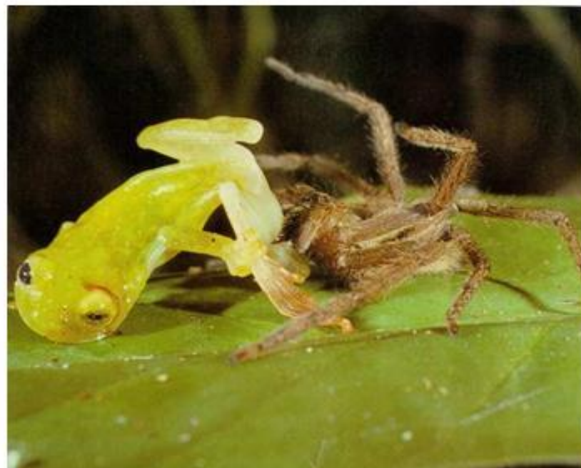
Паук, питающийся лягушками

Есть и большие пауки, которые едят птиц, мышей и лягушек.