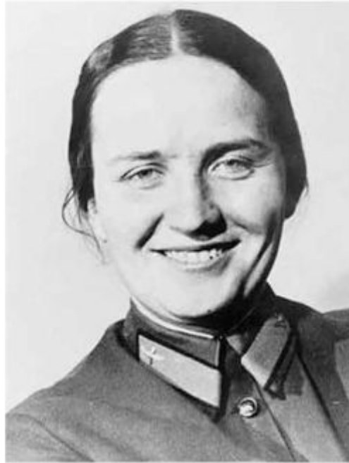
Марина Раскова 28 марта 1912 - 4 января 1943

Имя этой удивительной женщины увековечено в названиях улиц и площадей, теплоходов, военных училищ. О подвигах советской летчицы написаны книги и созданы кинофильмы. Чем же заслужила такое внимание москвичка Марина Раскова?