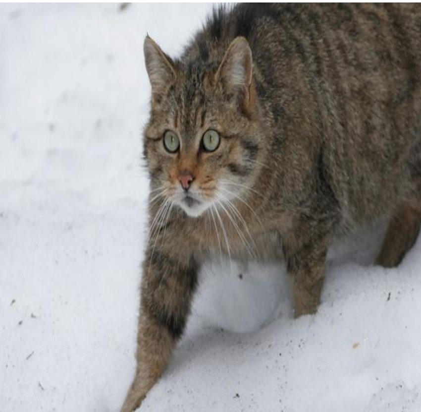
Амурский лесной кот