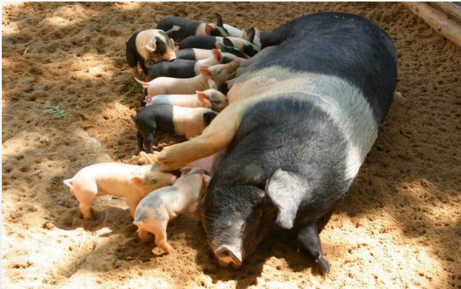
Свинья и поросята