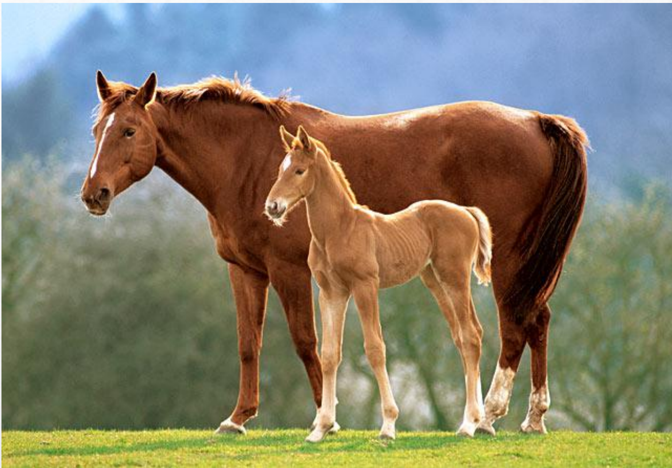
Лошадь и жеребенок