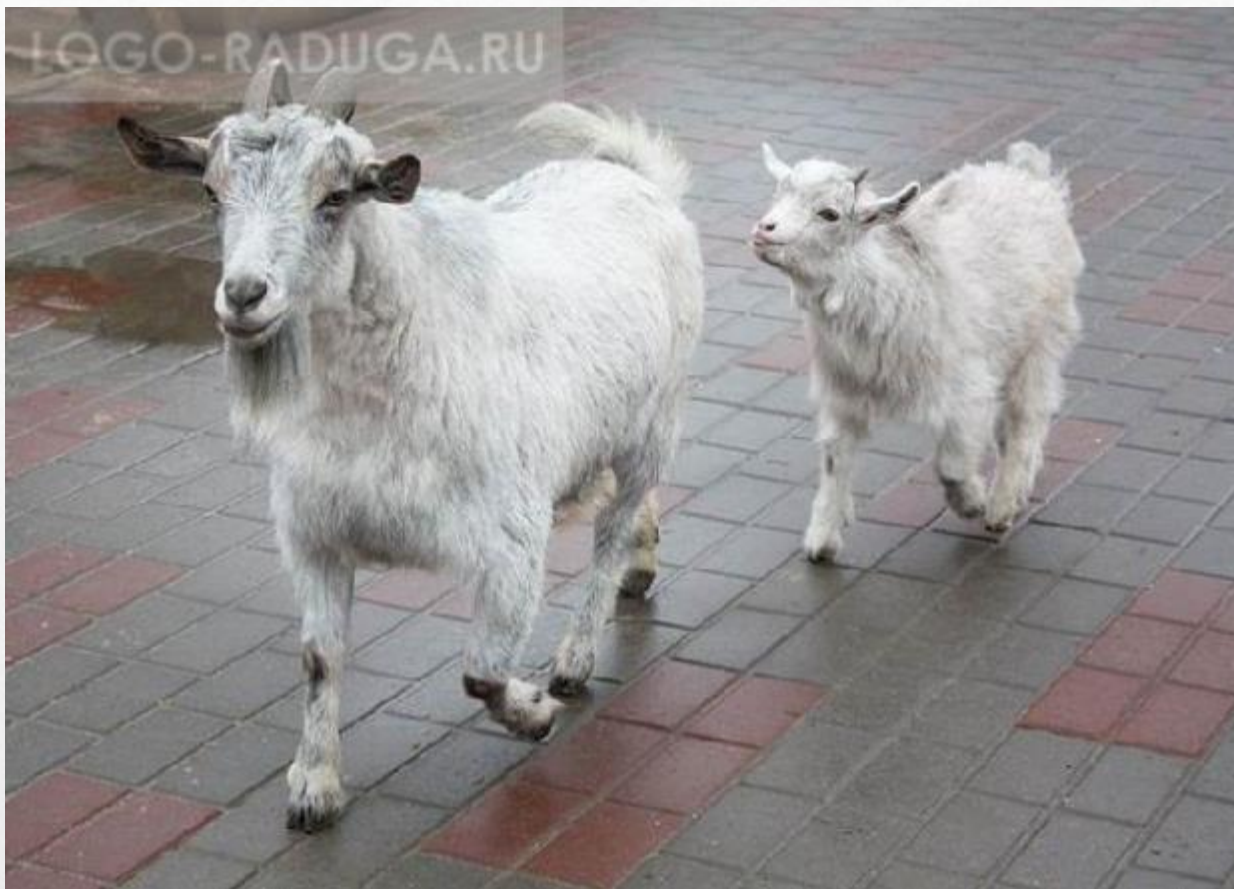
Козел и козленок