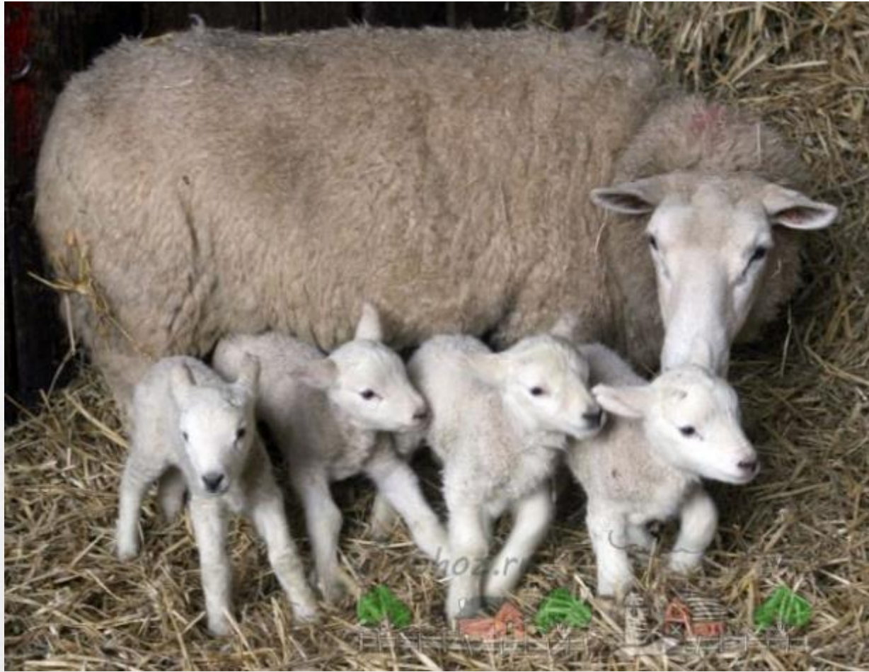
Овца с ягненком