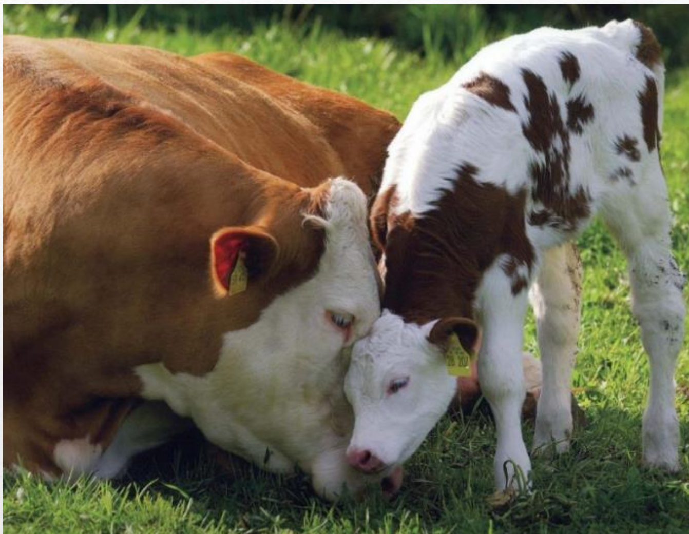
Корова и теленок