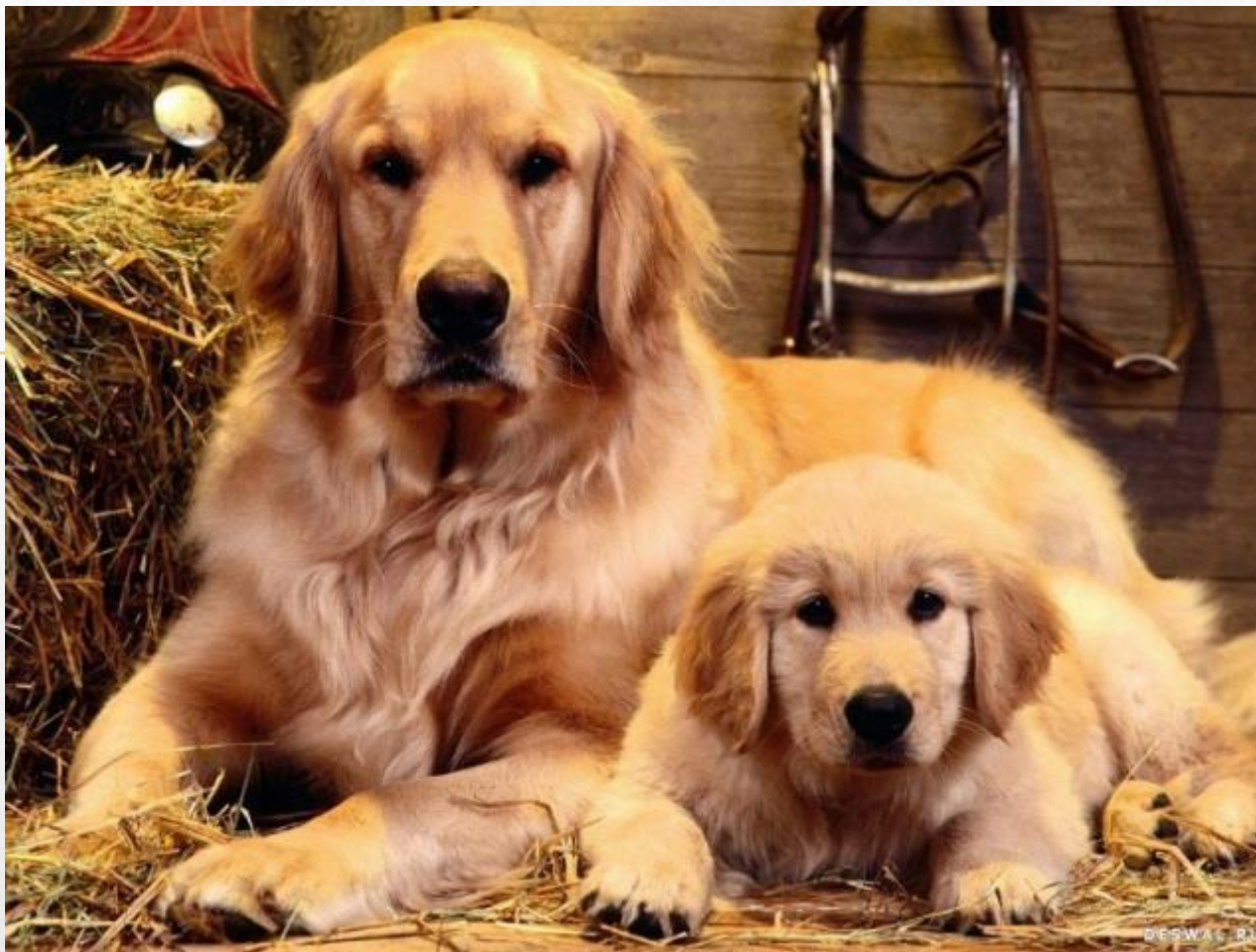
Собака и щенок