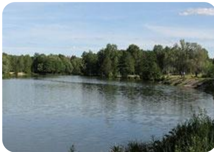
Пьют воду из реки