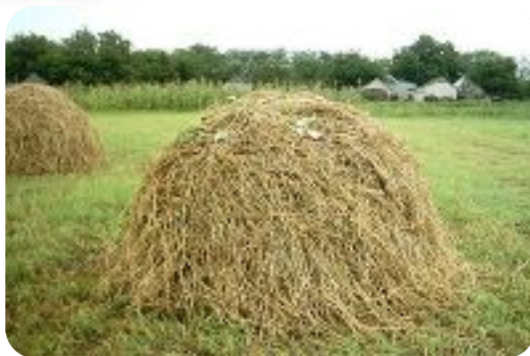
Зимой питаются сеном