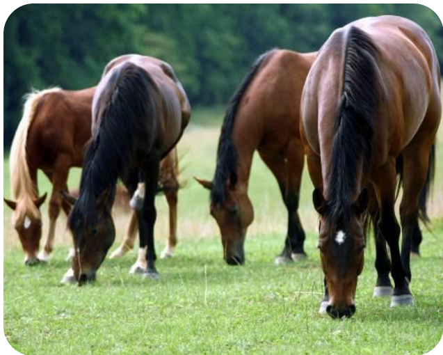
Пасутся на лугу