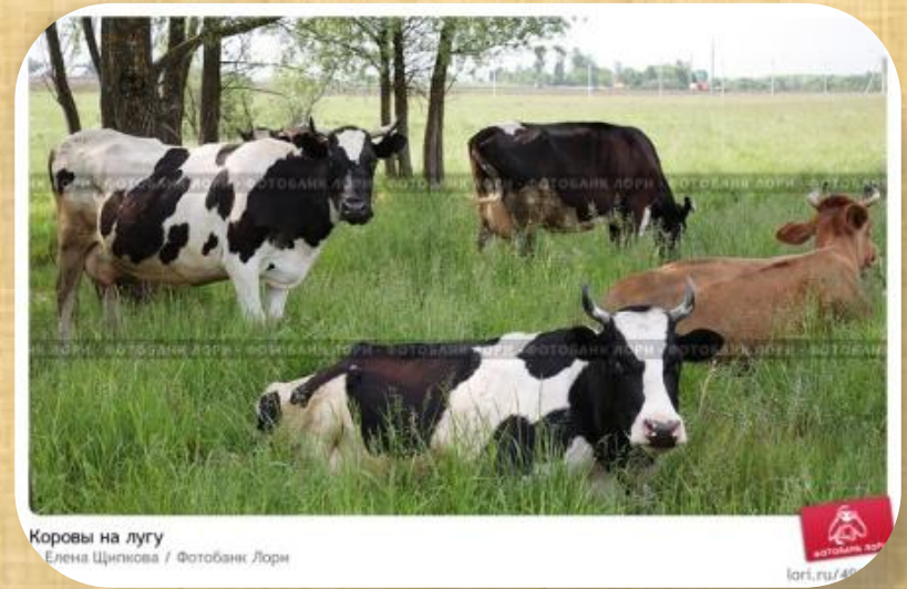
Коровы на лугу