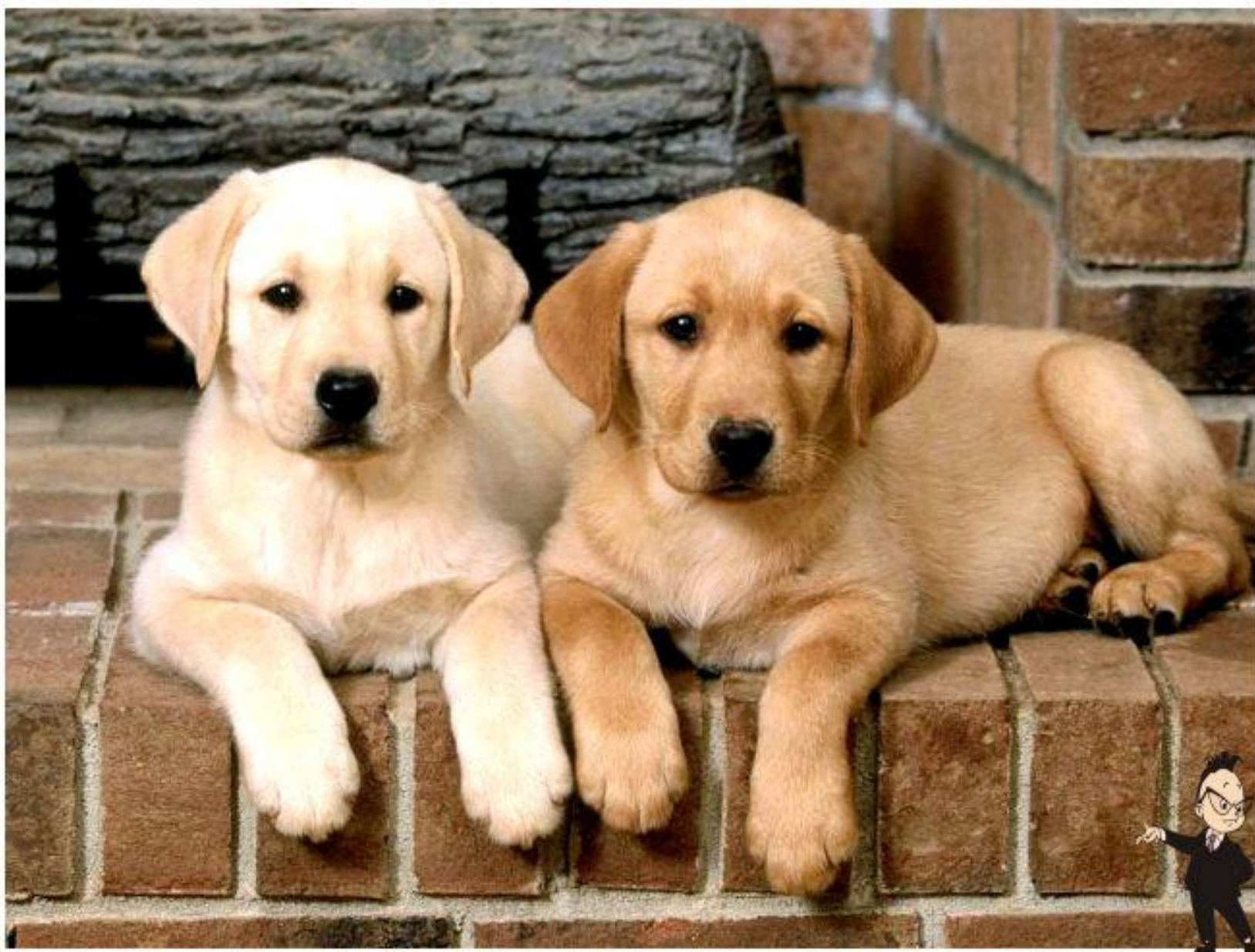
Щенки (один- щенок)