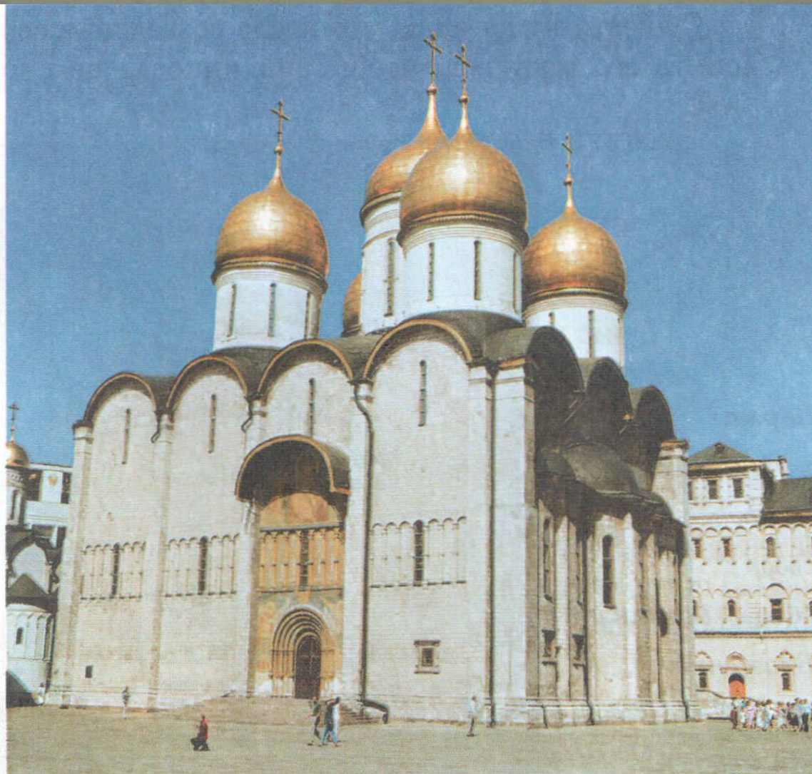
Успенский собор Московского Кремля. XV в.