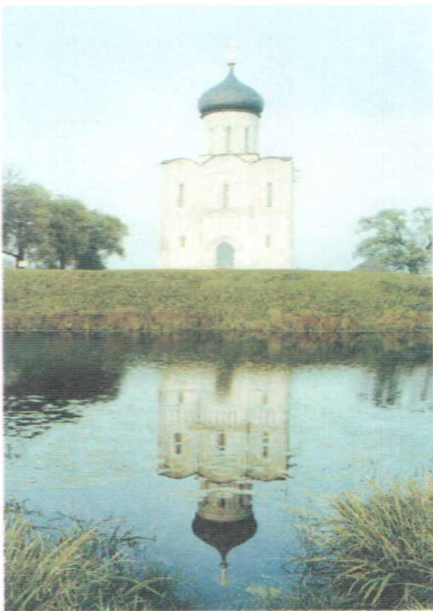
Храм Покрова на Нерли под Владимиром. 1165