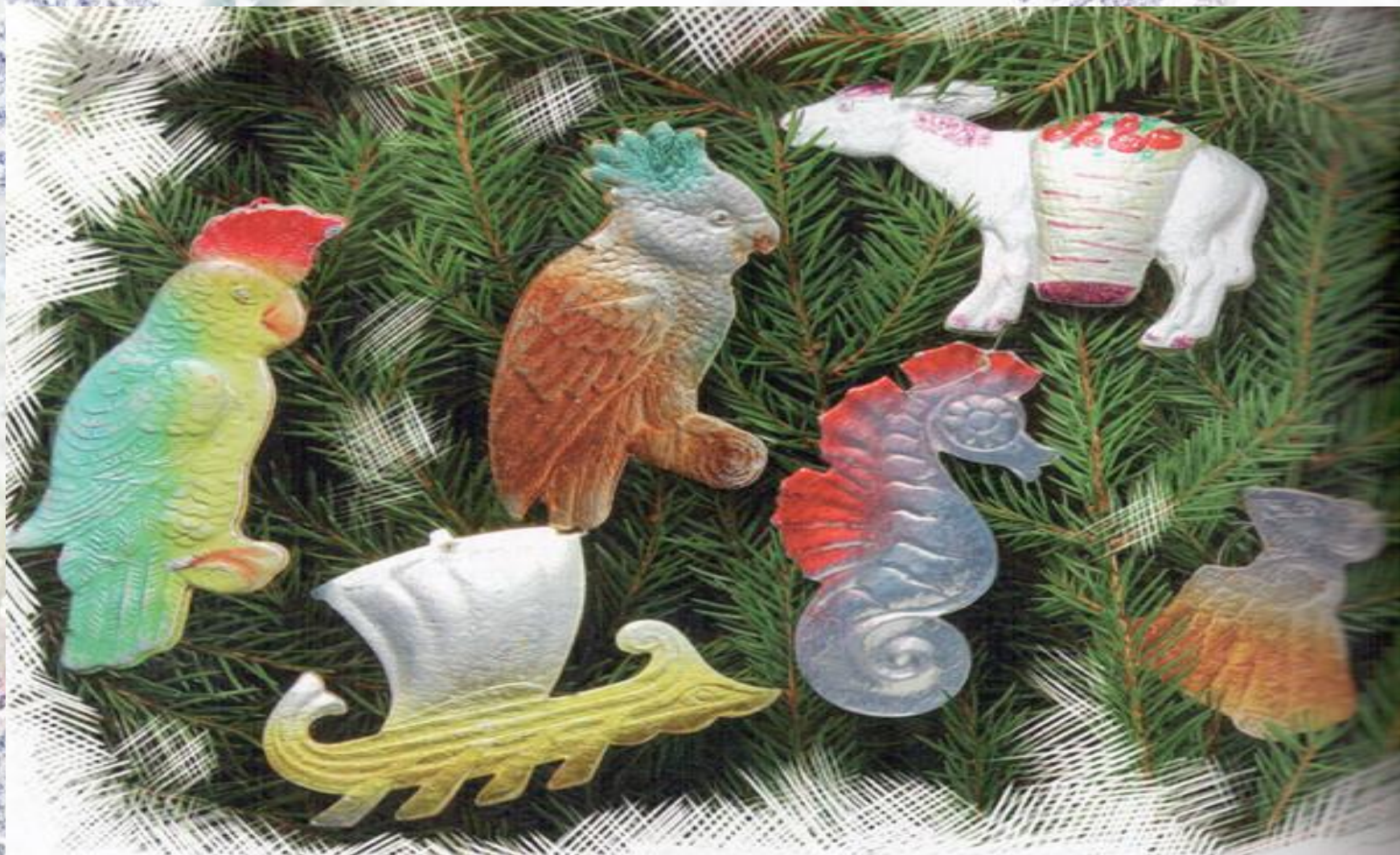
Ёлочные игрушки из прессованного картона.