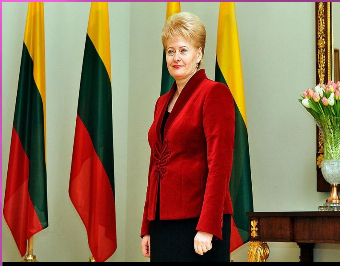
Даля Грибаускайте (вступила в должность 12 июля 2009 года )