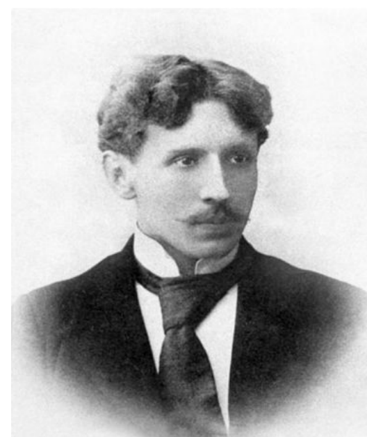
МИКАЛОЮС ЧЮРЛЁНИС (1875 – 1911)