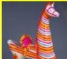
Конь - образ солнца