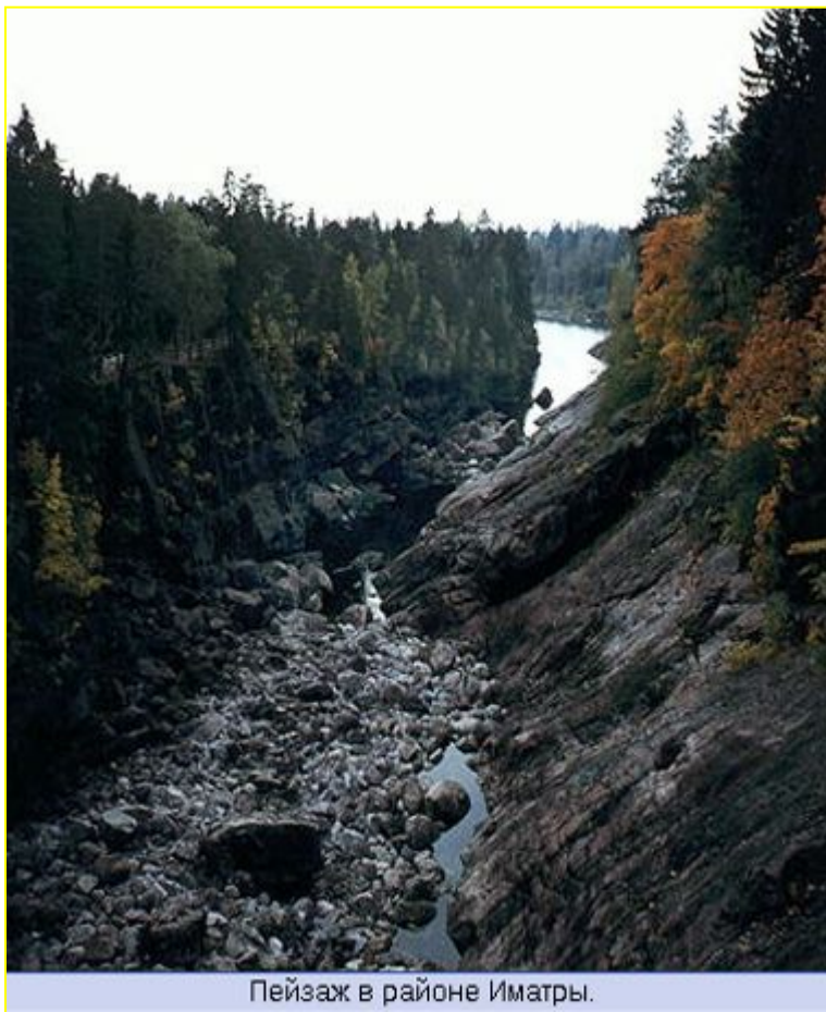
Пейзаж в районе Иматры.