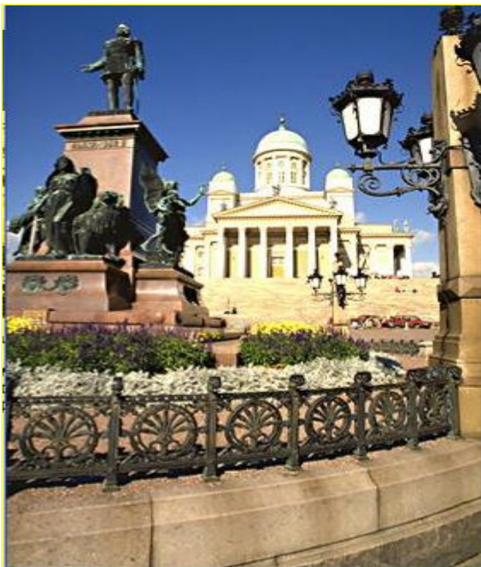
На Сенатской площади (главной площади Хельсинки) на переднем плане: памятник Александру II, на заднем — Лютеранский кафедральный собор.