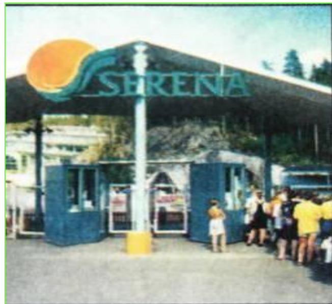
Вход в аквапарк «Серена»