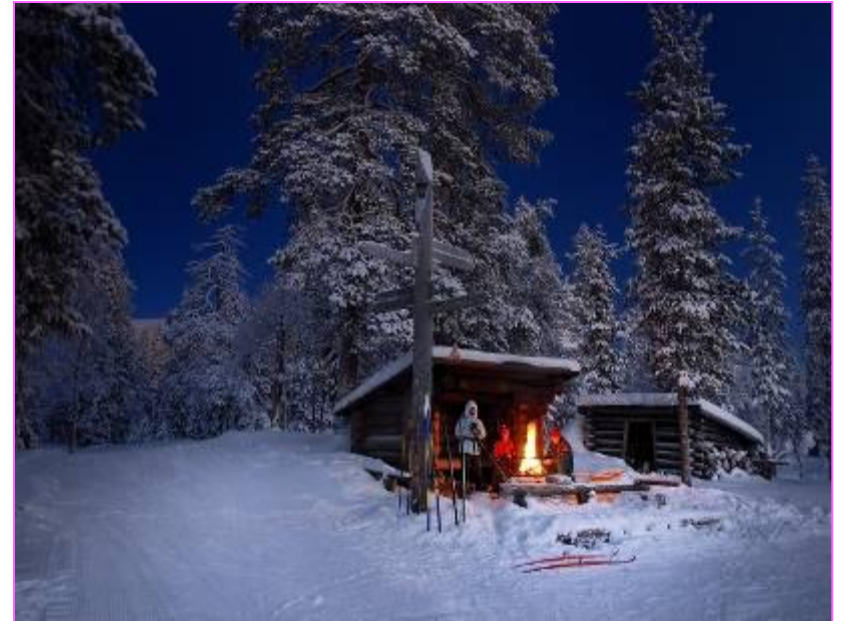
Активный отдых в Финляндии