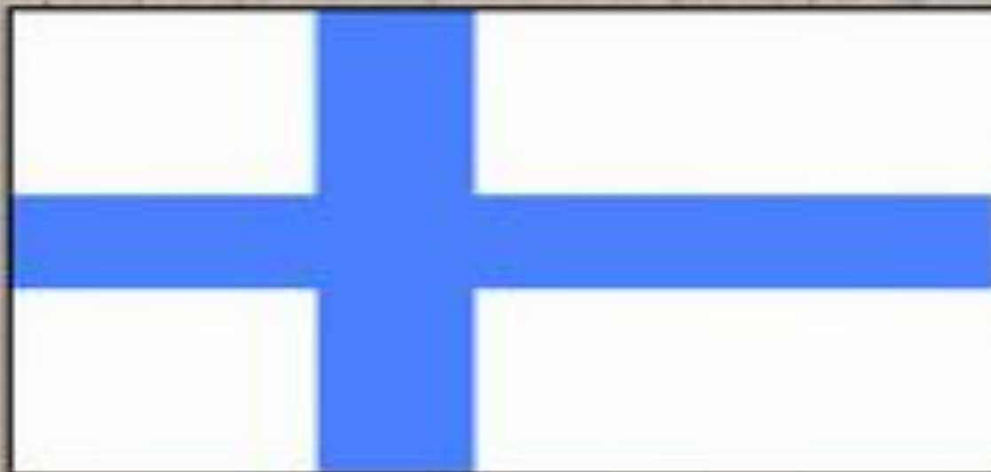
Государственный флаг Финляндии.