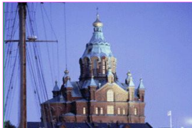
Успенский Кафедральный собор

Сенатская площадь — главная в Хельсинки. Это исторический центр города. Слева Государственный совет. Его здание было построено в 1822 году для сената — высшего органа самоуправления Великого княжества Финляндского. Справа Старая ратуша, построенная в начале 19 века. Оба здания построены в стиле классицизм.