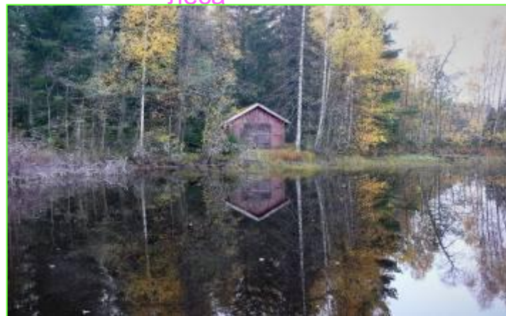
На берегу озера