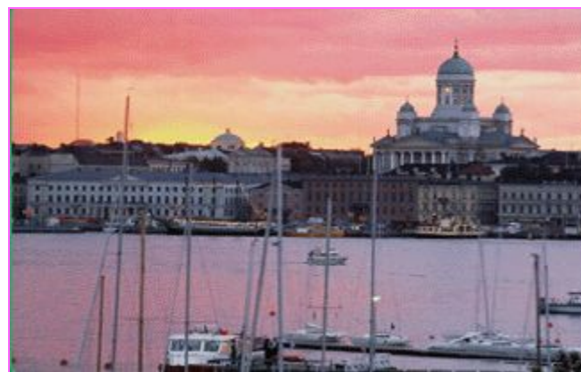
Южный порт Хельсинки