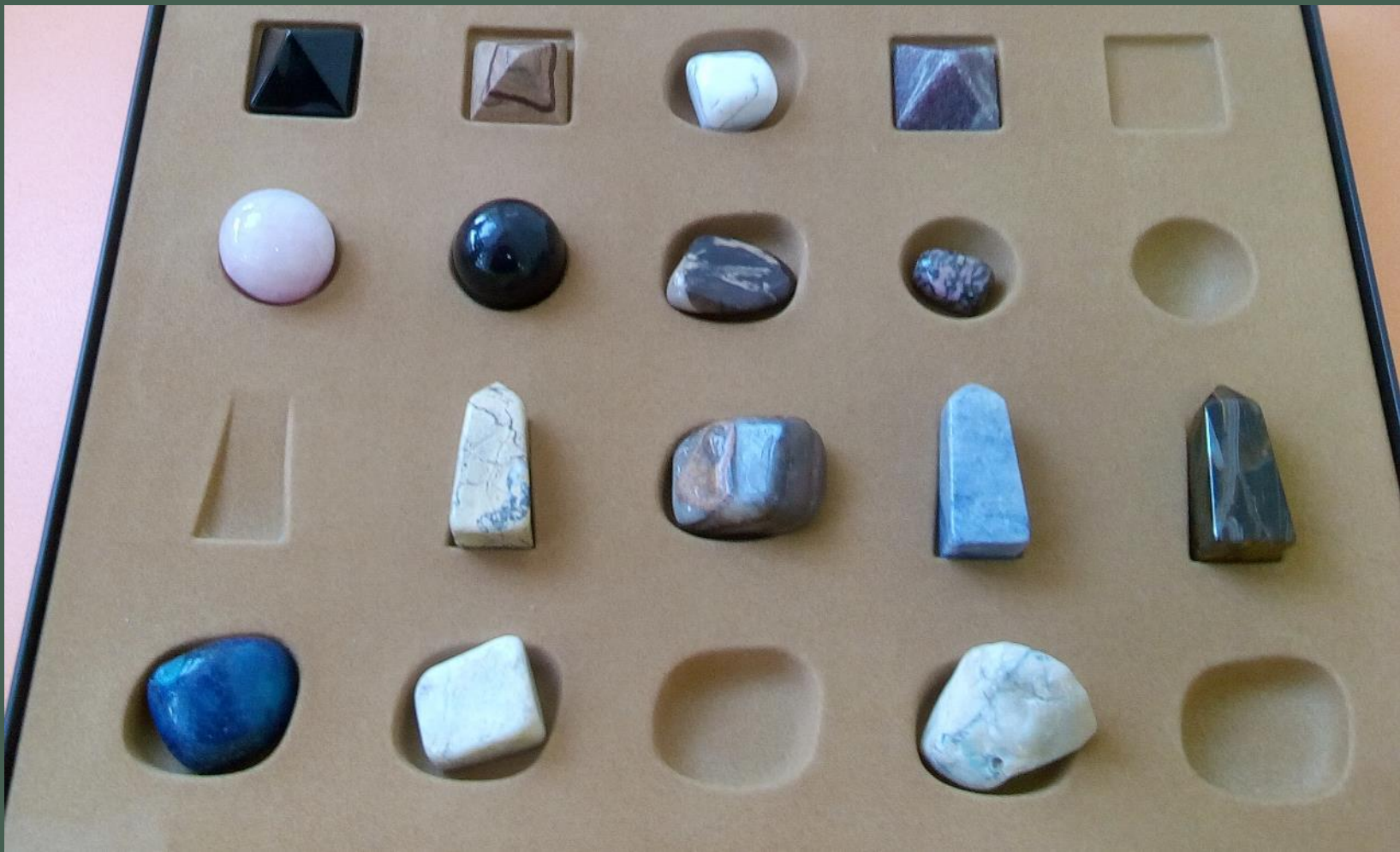
Коллекция «Сокровища Земли»