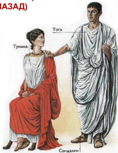
КОСТЮМ ДРЕВНИХ ГРЕКОВ (3000 ЛЕТ НАЗАД)