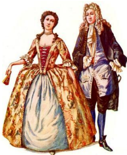
КОСТЮМ 300 ЛЕТ НАЗАД