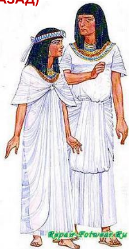
КОСТЮМ ДРЕВНИХ ЕГИПТЯН (5000 ЛЕТ НАЗАД)