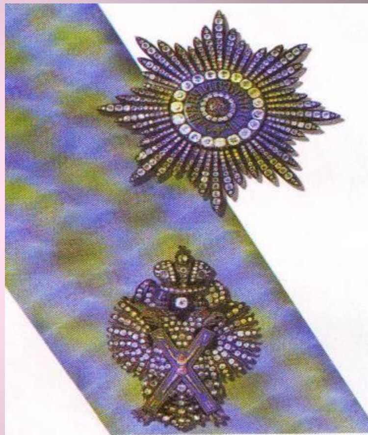
Орден Святого апостола Андрея Первозванного: знак, лента, звезда