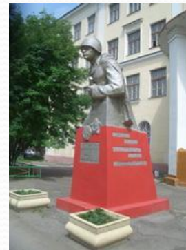
Памятник солдатам 322-ой стрелковой дивизии, погибшим в годы Великой Отечественной войны 1941-1945 гг. Ленинский район (ул. Комарова, 6)

Мир и дружба всем нужны, Мир важней всего на свете, На земле, где нет войны, Ночью спят спокойно дети. Там, где пушки не гремят, В небе солнце ярко светит. Нужен мир для всех ребят. Нужен мир на всей планете!