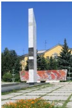
Мемориал Славы в память о работниках авиационного завода «Сокол», погибших на фронтах Великой Отечественной войны 1941-1945 гг. Московский район (ул. Чаадаева, 9 ОАО НАЗ «Сокол»)