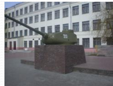
Мемориал Славы Герою Советского Союза В.К. Ключеву и работникам эвакогоспиталя № 2808 Московский район (ул. Просвещенская около МОУ СОШ №115)