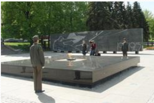
Памятный комплекс с Вечным Огнем в честь горьковчан, погибших в годы Великой Отечественной войны 1941-1945 гг. Нижегородский район