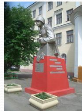
Памятник солдатам 322-ой стрелковой дивизии, погибшим в годы Великой Отечественной войны 1941-1945 гг. Ленинский район (ул. Комарова, 6)

Мир и дружба всем нужны, Мир важней всего на свете, На земле, где нет войны, Ночью спят спокойно дети. Там, где пушки не гремят, В небе солнце ярко светит. Нужен мир для всех ребят. Нужен мир на всей планете!