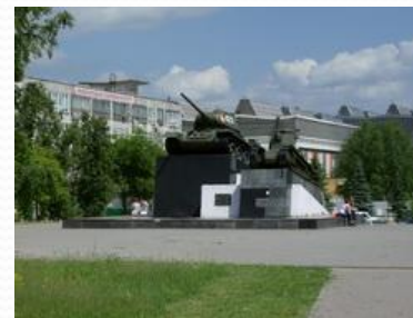
Мемориальный комплекс «Танки «Борец за свободу тов. Ленин» и «Т-34» Сормовский район (пл. Славы)