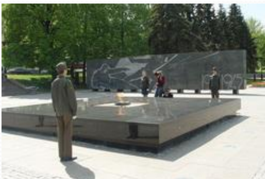
Памятный комплекс с Вечным Огнем в честь горьковчан, погибших в годы Великой Отечественной войны 1941-1945 гг. Нижегородский район