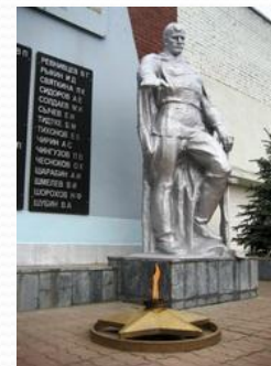
Скульптура солдата со стелой (рабочим АО «Мельинвест») Канавинский район (ул. Интернациональная, 95)