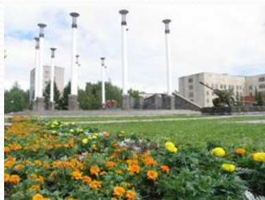
Мемориальный комплекс «Победа» Приокский район (пл. Жукова)