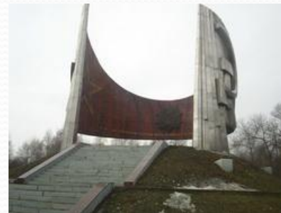
Монумент Славы с Вечным Огнем в ознаменование боевого и трудового подвига автозаводцев в годы Великой Отечественной войны 1941-1945 гг. Автозаводский район (пр. Ленина, парк Славы)