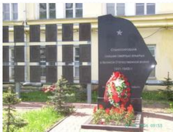
Обелиск воинам, погибшим в годы ВОВ (со списком) Ленинский район (ул. Памирская) ОАО «ЗеФС»

Мир и дружба всем нужны, Мир важней всего на свете, На земле, где нет войны, Ночью спят спокойно дети. Там, где пушки не гремят, В небе солнце ярко светит. Нужен мир для всех ребят. Нужен мир на всей планете!