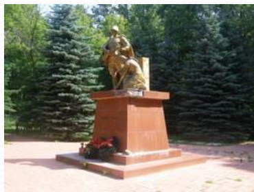
Комплекс участков захоронений воинов, умерших от ран в эвакогоспиталях в годы Великой Отечественной войны 1941-1945 гг. Советский район (кладбище «Марьино роща»)