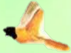
охота в воздухе