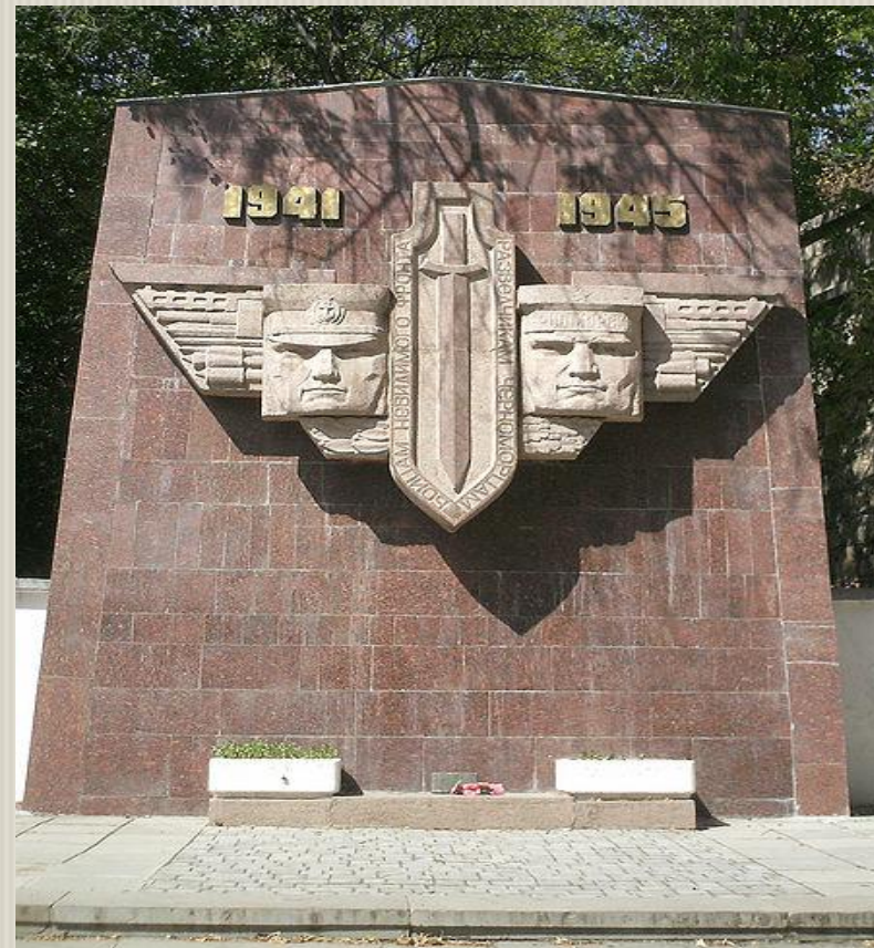
Памятник разведчикам черноморского флота