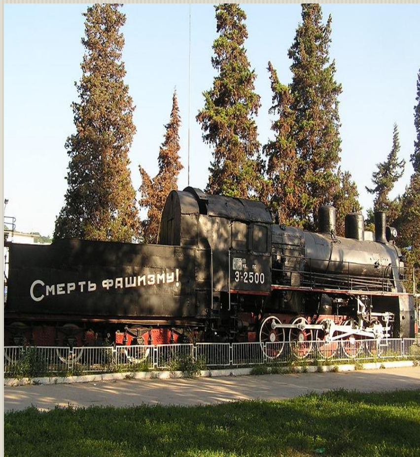
Паровоз бронепоезда «Железняков»