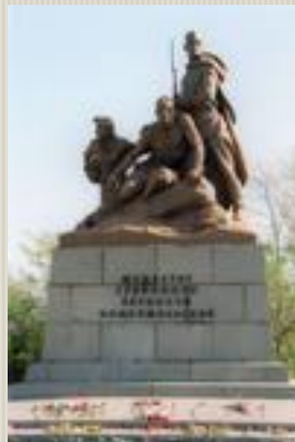
Памятник комсомольцам, погибшим в годы Великой Отечественной войны