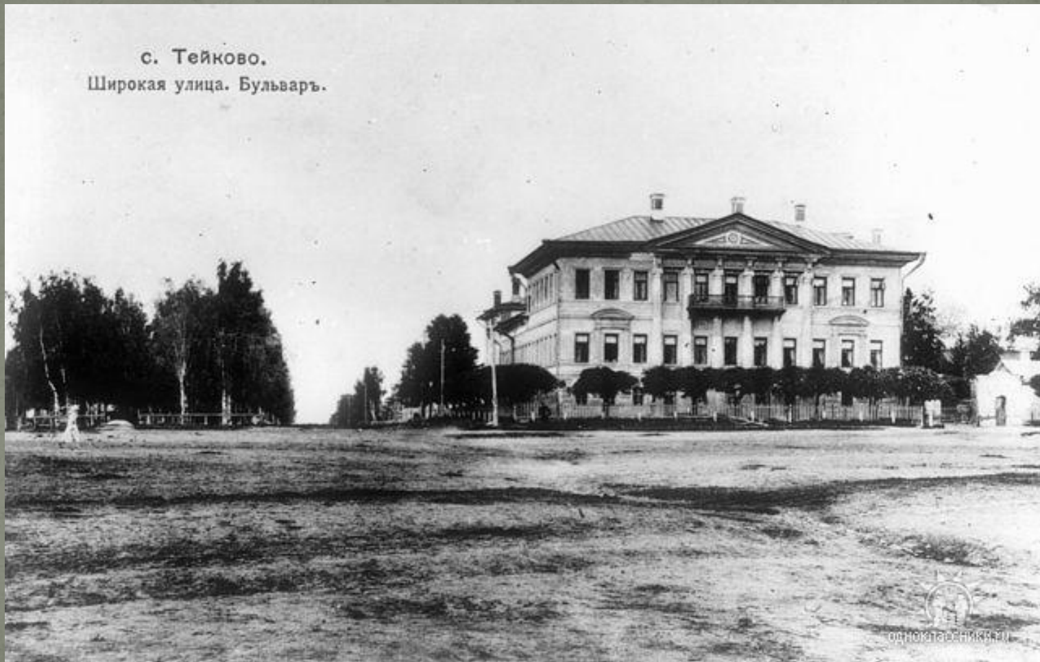
с. Тейково. Широкая улица. Бульваръ.