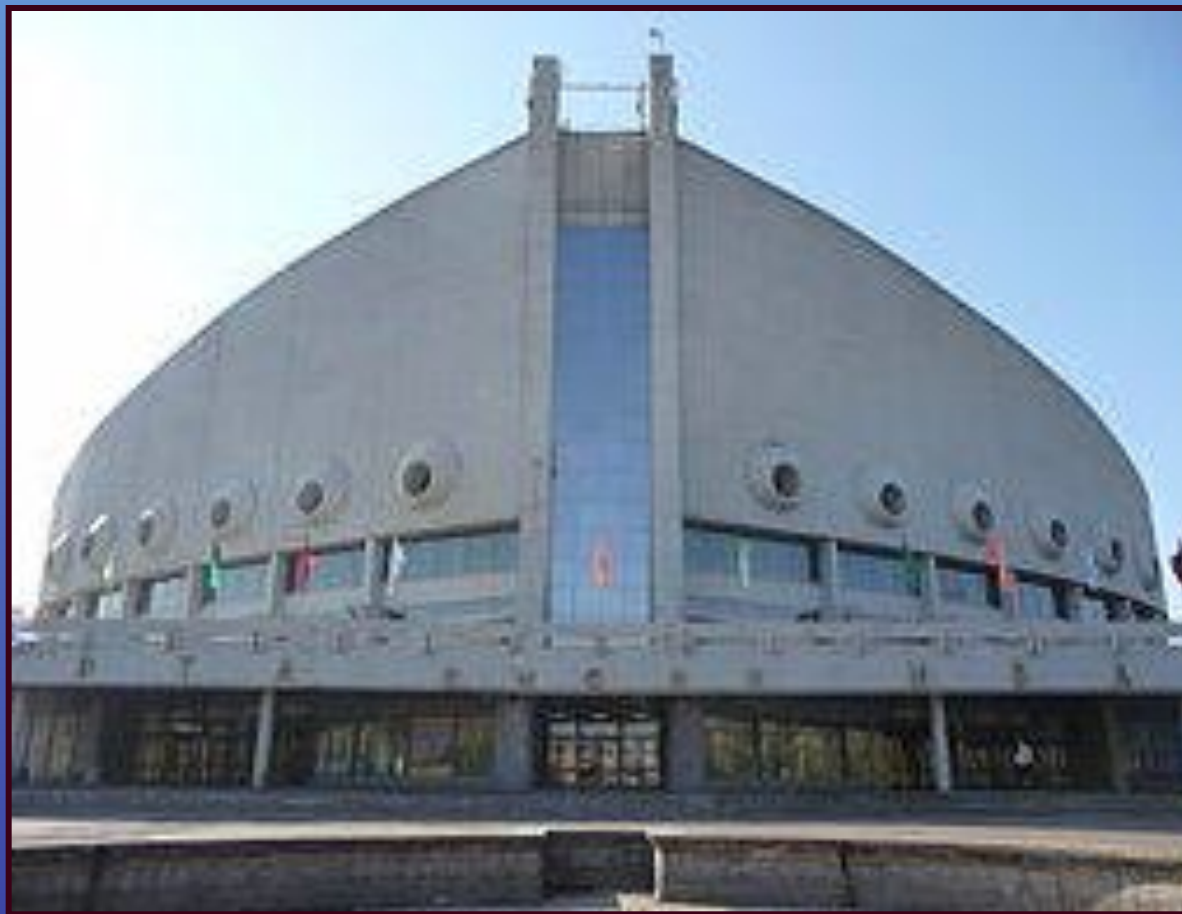
Красноярский Дворец спорта

С историческими памятниками соседствуют современные архитектурные формы.