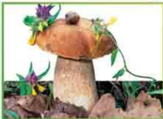
белый гриб (еловый)