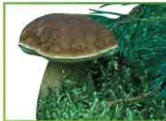
белый гриб (сосновый)