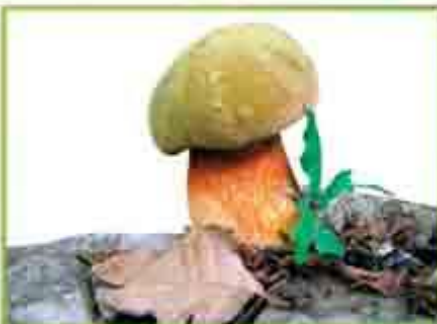
белый гриб (дубовый)