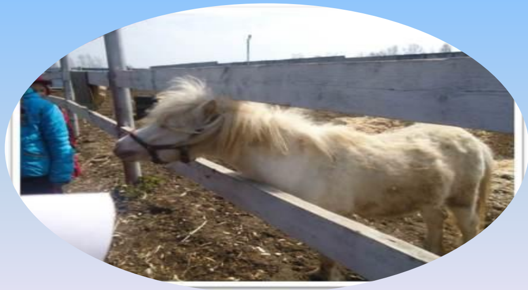
Принц ,ему 10 лет