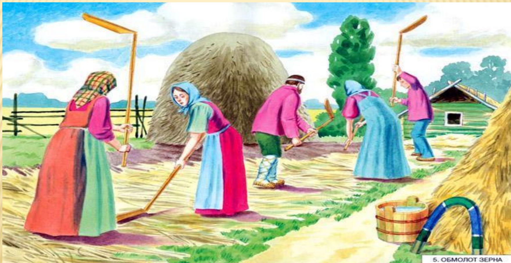
5. ОБМОЛОТ ЗЕРНА