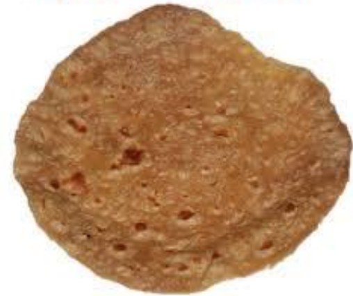
Первый печеный хлеб

Среди историков нет единой версии, как древние люди сообразили запекать первый хлеб. Но распространено мнение, что это произошло случайно, когда зерновая смесь перелилась через край горшка и запеклась. Вот с тех пор человечество и употребляет печеный хлеб.