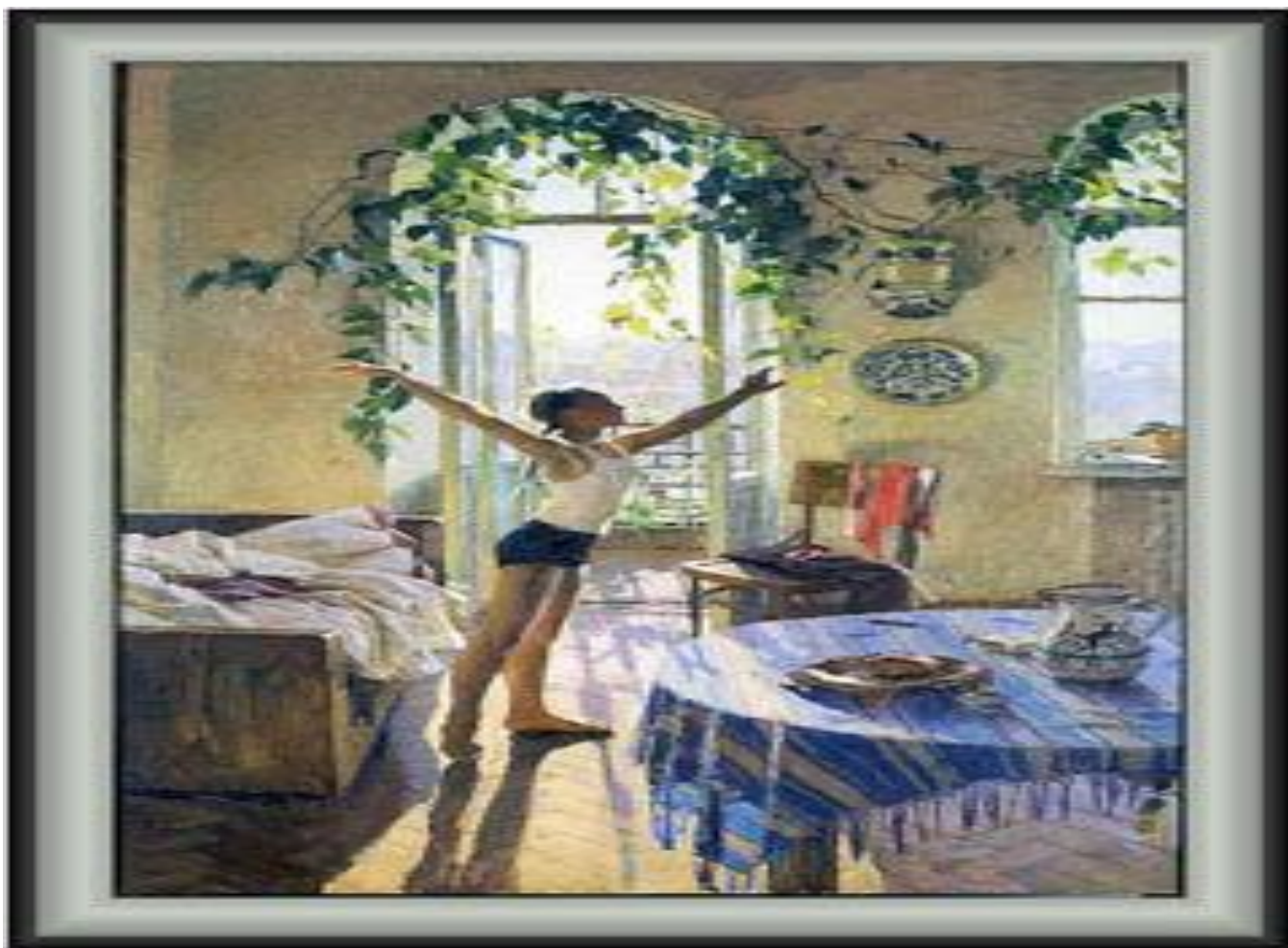
Т. Н. Яблонская «Утро».