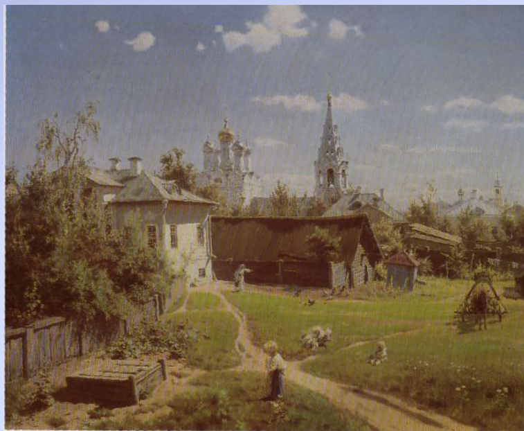
Поленов В.Д. Московский дворик