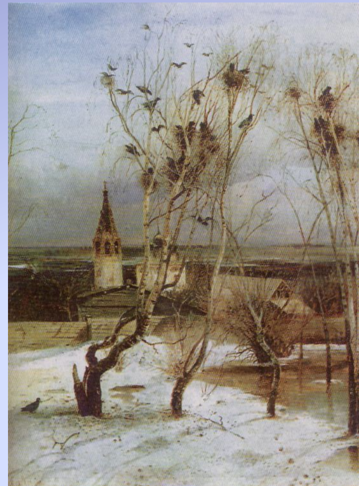
Алексей Саврасов. Грачи прилетели