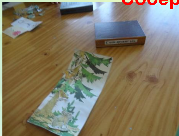
С кем дружит ель