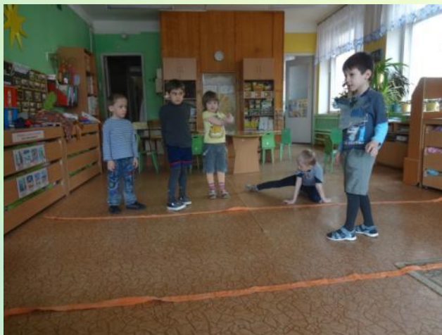
Волк во рву