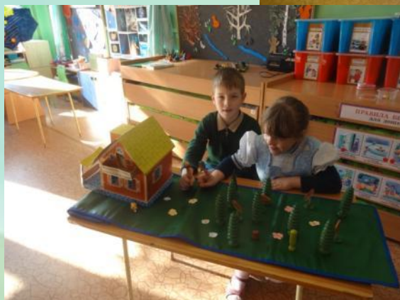
В какую игру я