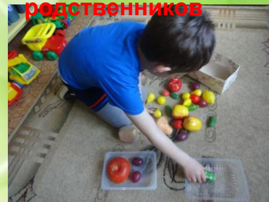
Разложи по группам