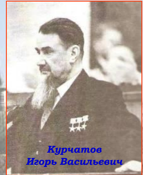
Курчатов Игорь Васильевич

В 1988 году одной из новых улиц присвоено имя великого ученого, физика И.В.Курчатова, руководителя лаборатории №2 АН СССР