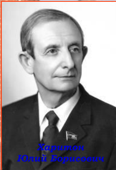
Харитон Юлий Борисович

Названа в честь академика Ю. Б.Харитона, первого главного конструктора секретного объекта, разработчика первой советской атомной бомбы (1997 год)