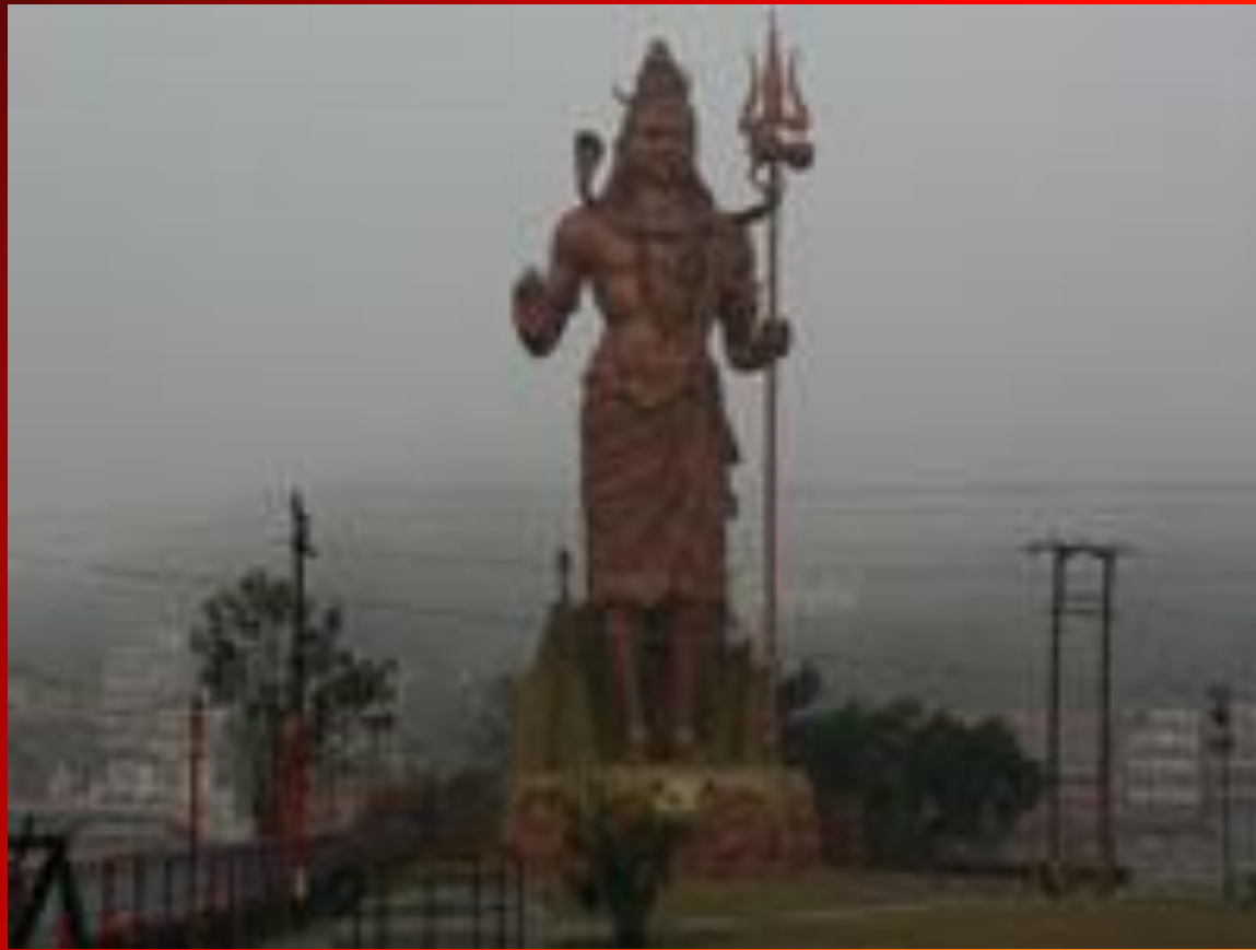
Храм Шри Шивы в Харидваре

В период с начала 18 века по середину 20 века Индия была постепенно колонизирована Британской империей. Получив независимость в 1947 году,