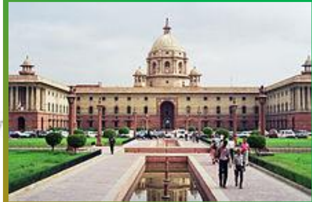
Столица Индии Дели