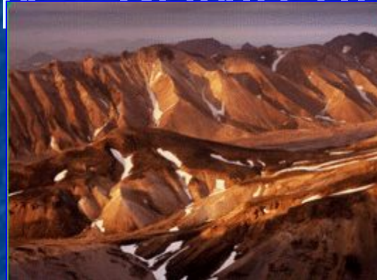
Исландия – гористый остров с действующими вулканами