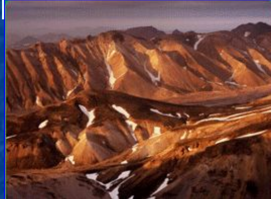
Исландия – гористый остров с действующими вулканами