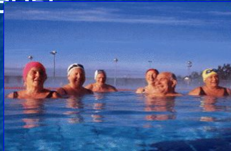
Группа пожилых людей в открытом бассейне