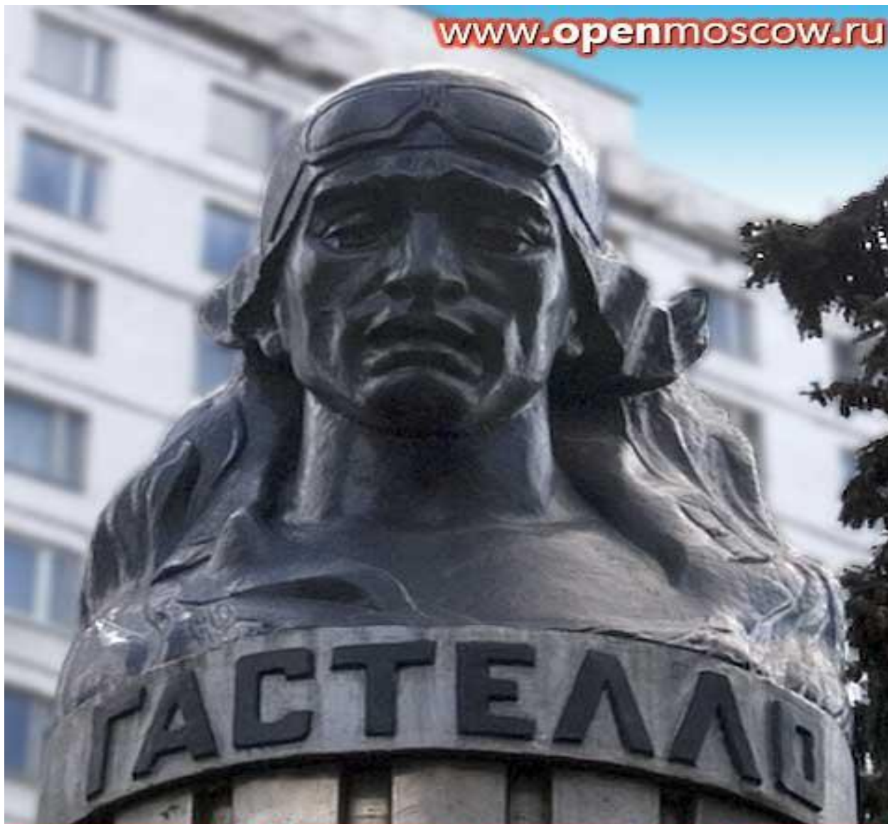
Памятник Н.Ф.Гастелло | Скульптор Б.А.Мочков Гастелло ул, 2/22, метро "Сокольники"