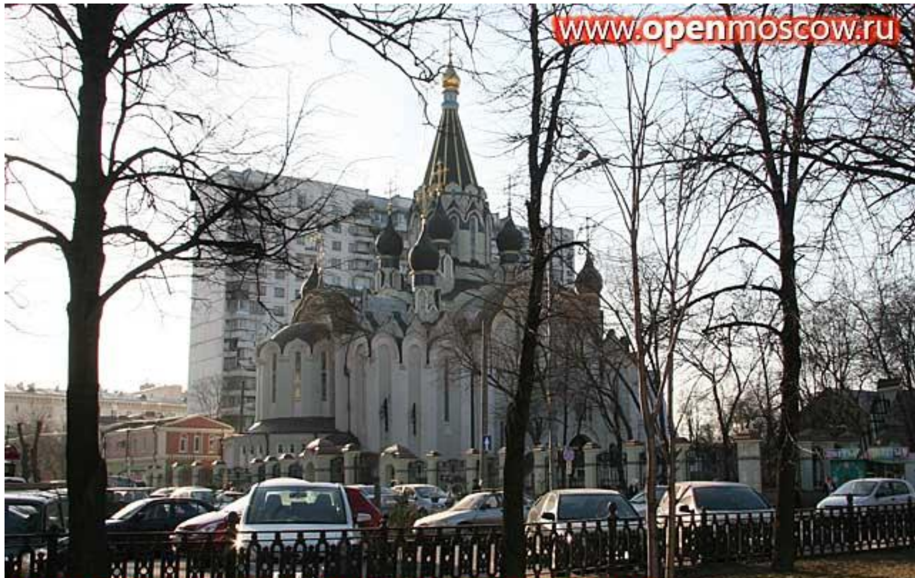
Церковь Воскресения Христова в Сокольниках Вид с Сокольнической площади