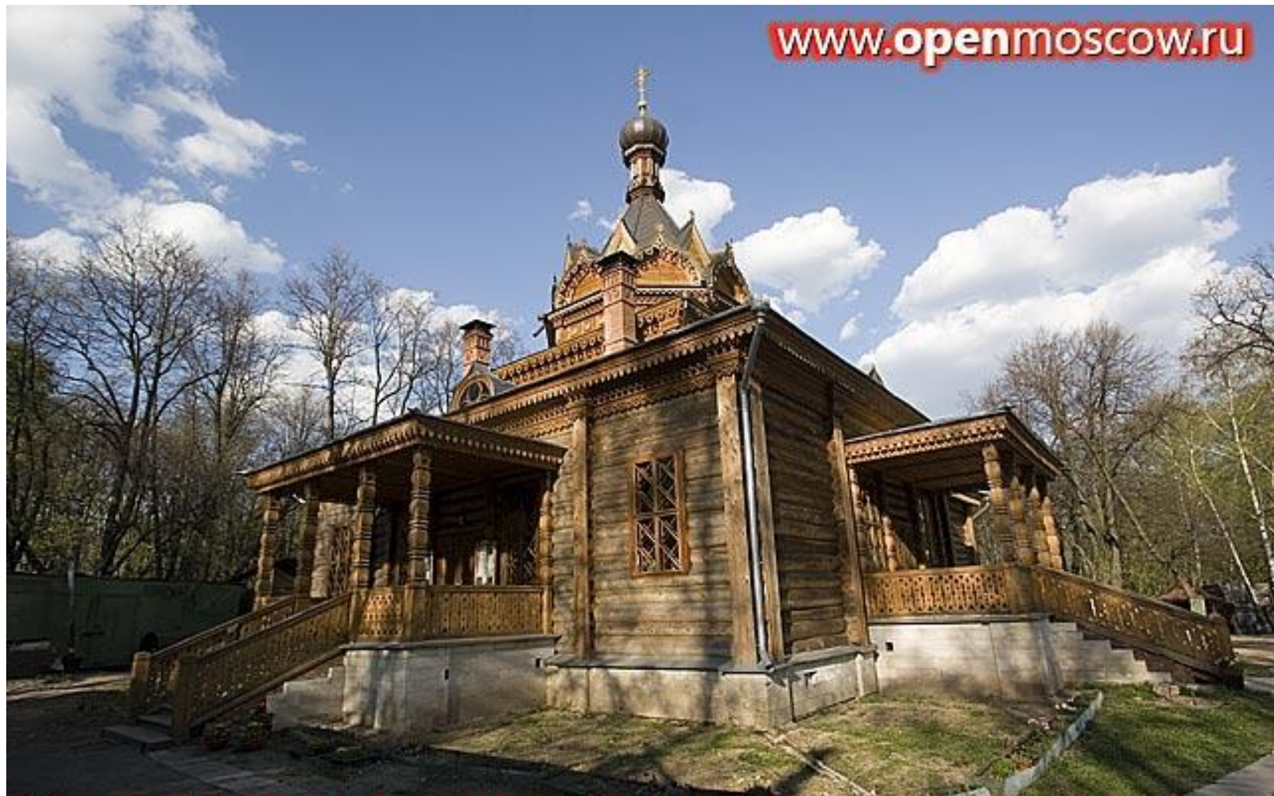
Церковь Тихона Задонского Вид с юго-западной стороны Парк "Сокольники", Майский просек, 7, метро "Сокольники"