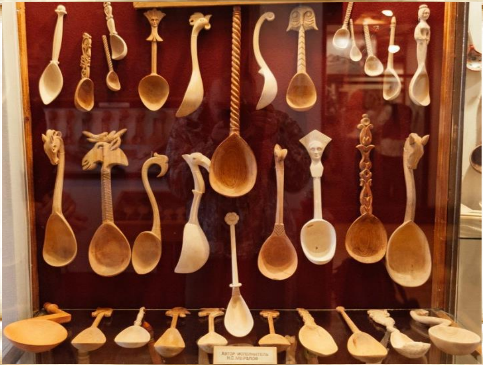
АВТОР: ВОЛОДИМИР В.С. МЕЛНИКОВ