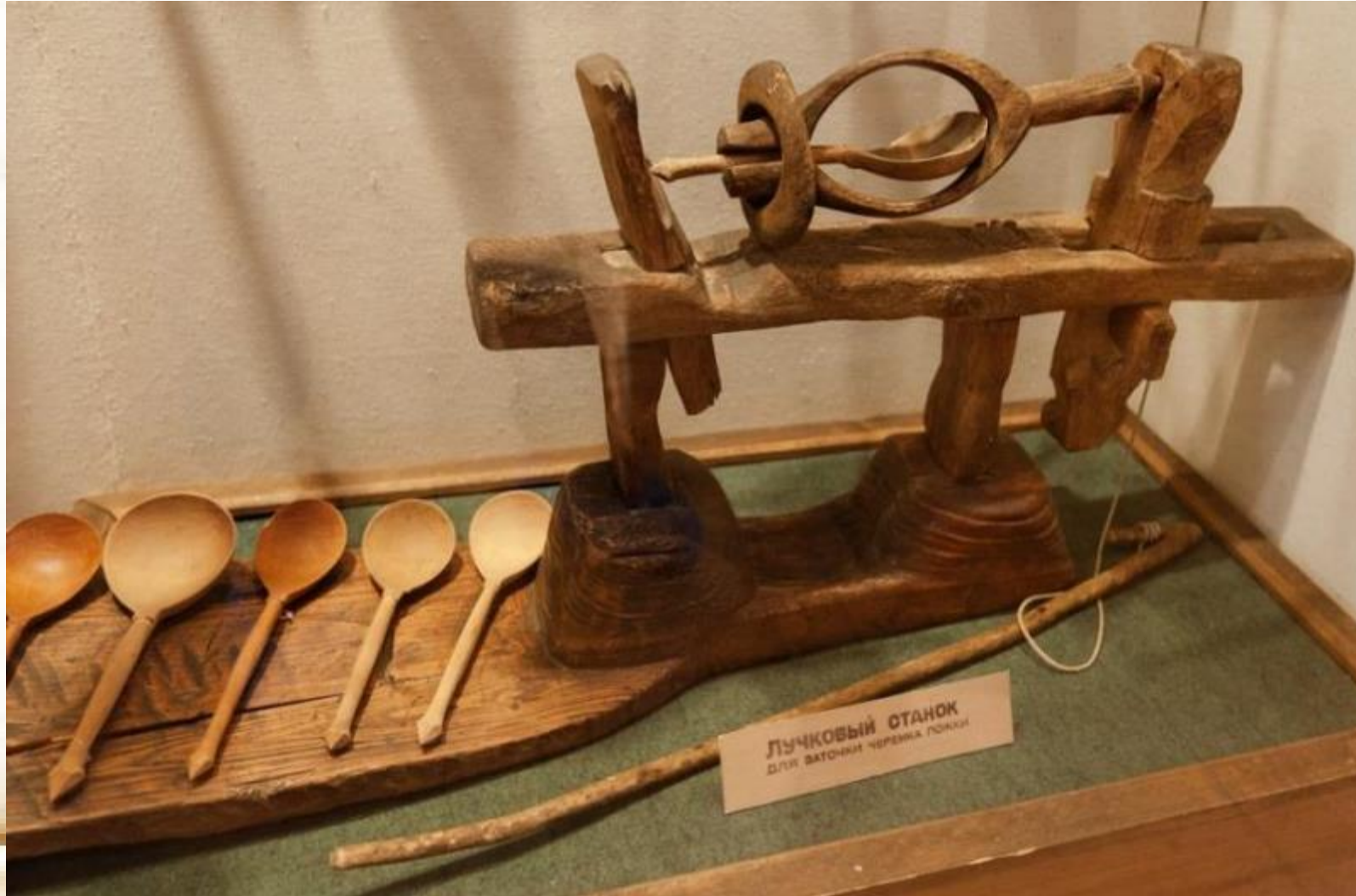
ЛУЧКОВЫЙ СТАНОК ДЛЯ ВАТОЧКИ ЧЕРЕНОК ЛОЖКИ