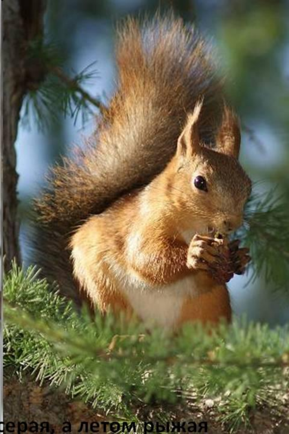
Зимой белка серая, а летом рыжая