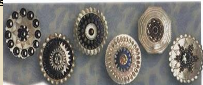
Пуговицы из целлулоида. Начало XX в.