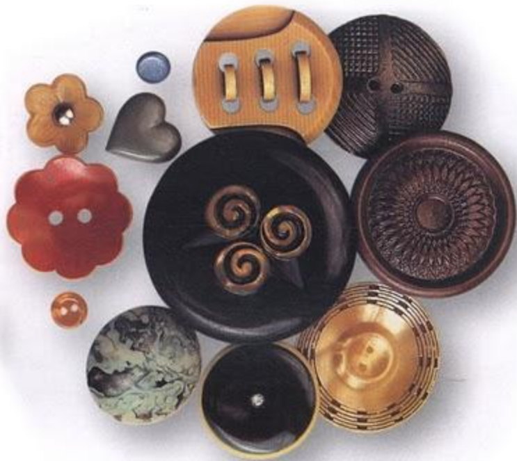
Пластмассовые пуговицы. США. 30-е гг. XX в.