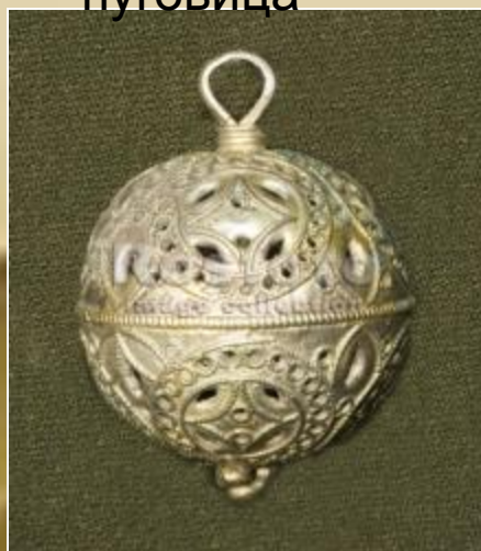
Пуговица 16-18 век