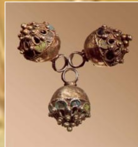
Пуговицы 17 век