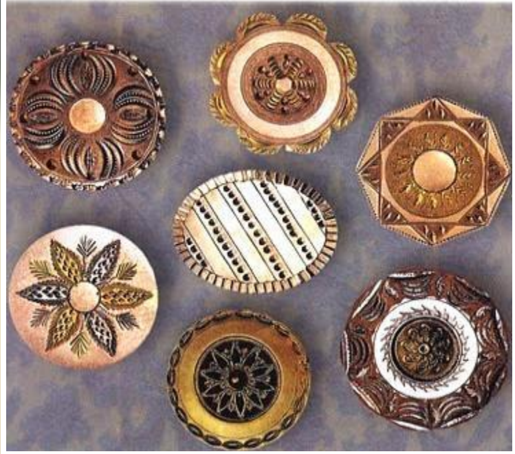
Медные пуговицы. Предположительно Англия. XVIII в.