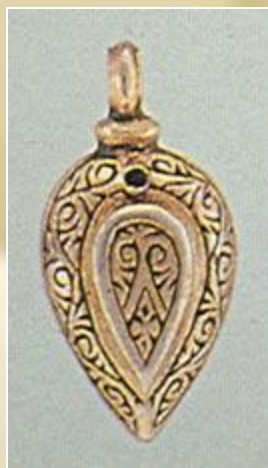
Пуговица. Серебро, позолота.