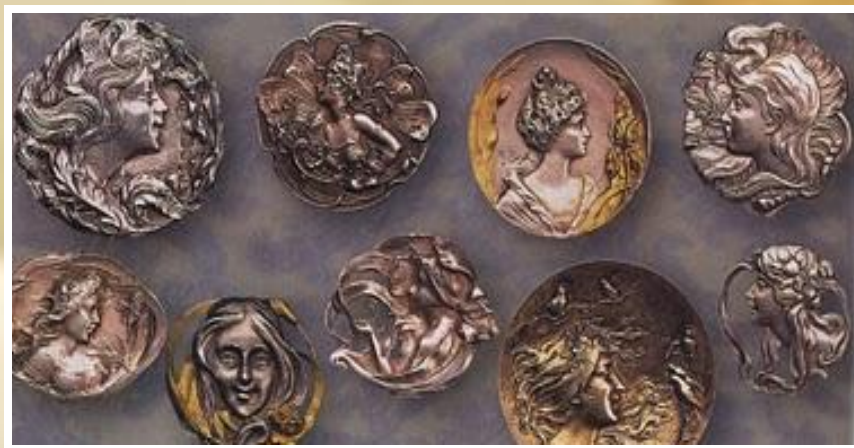
Серебряные английские и французские пуговицы в стиле модерн. 1900-1910 гг.