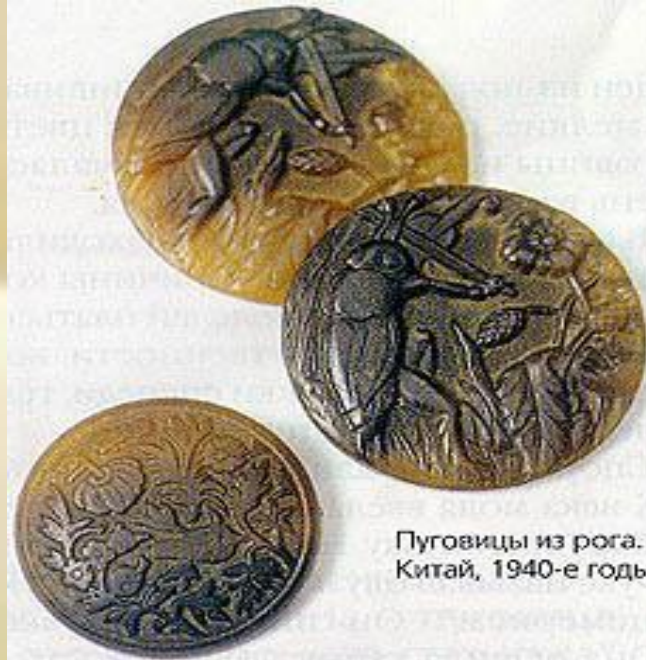
Пуговицы из рога. Китай, 1940-е годы.