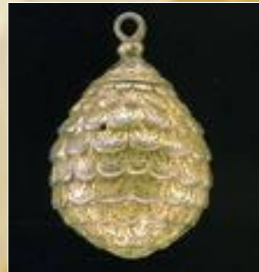
Пуговица. Серебро. Вторая половина 17 века.