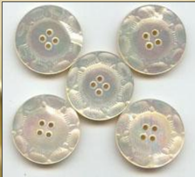
Пуговицы перламутр 19 век