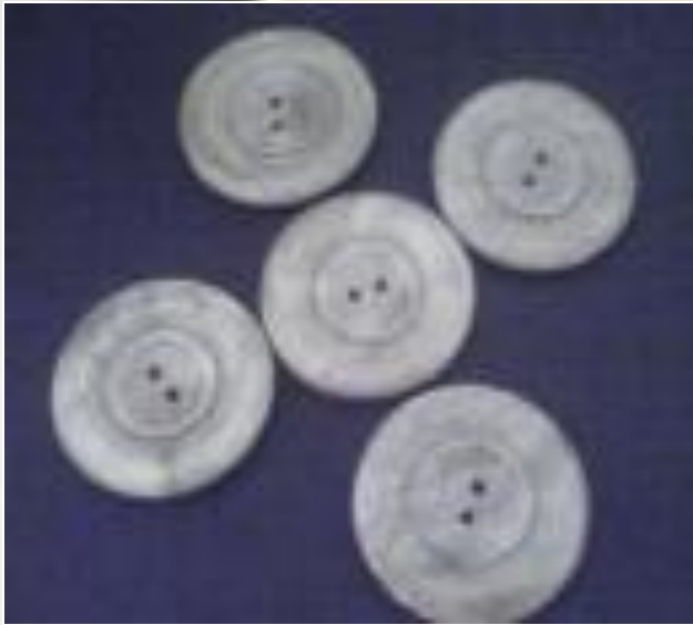
Пуговицы 1930-2000 гг. Фотогалерея. Музей Моды...