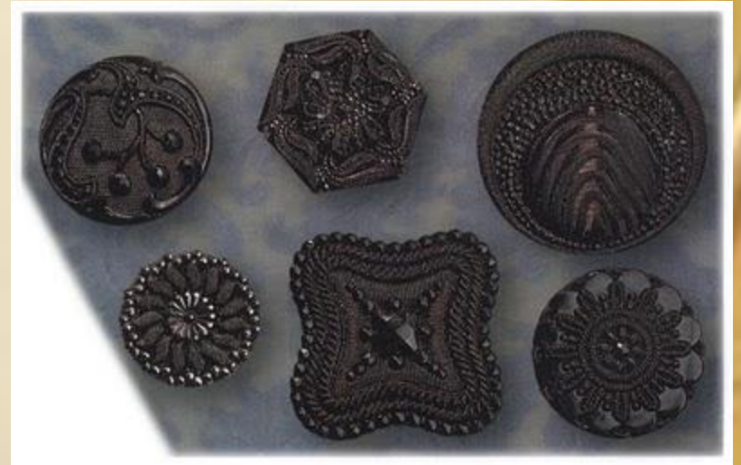
Пуговицы из черного стекла