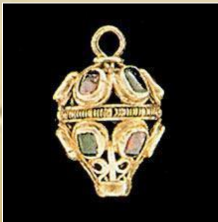
Пуговица. Золото, рубины, изумруды