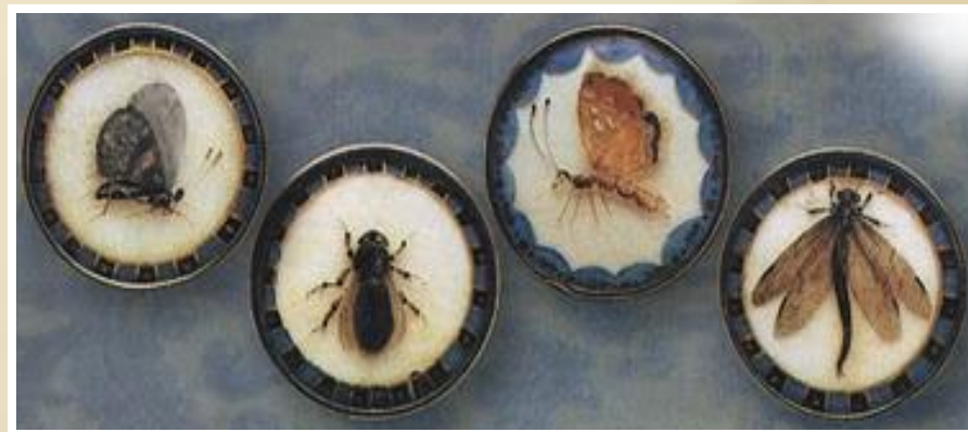
Пуговицы с изображением насекомых, покрытые стеклом. Середина или конец XVIII в.