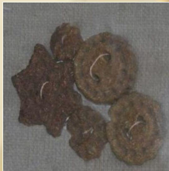
Пуговицы из хлеба