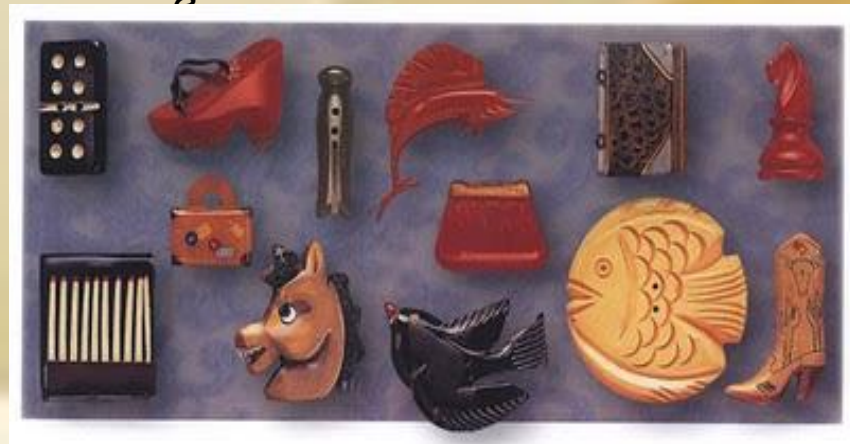
Пластмассовые пуговицы. США. 30-е гг. XX в.

В 20-е гг. XX века были наиболее распространены пуговицы из пластика бакелита , именовавшегося «материалом тысячи возможностей».