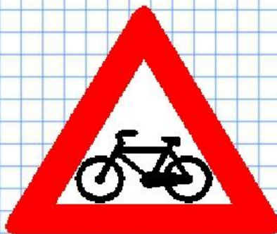
Пересечение с велосипедной дорожкой