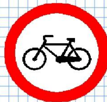
Движение на велосипеде запрещено