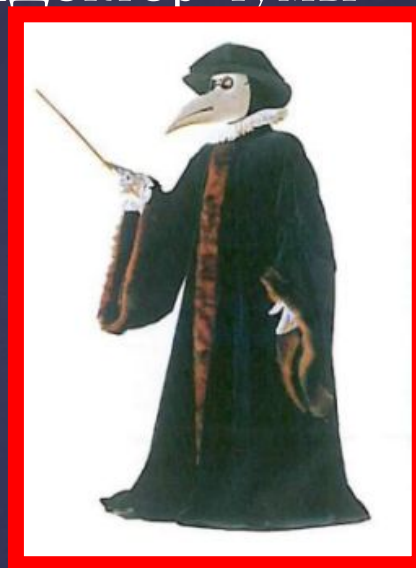
□ Доктор чумы