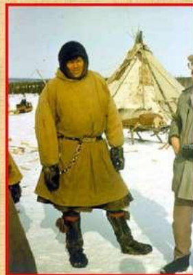
Традиционная меховая одежда ижемских оленеводов. Интинский район