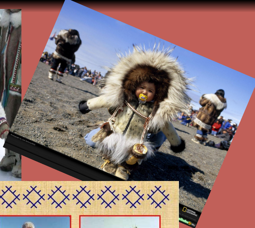
верхняя одежда северных коми-зырян