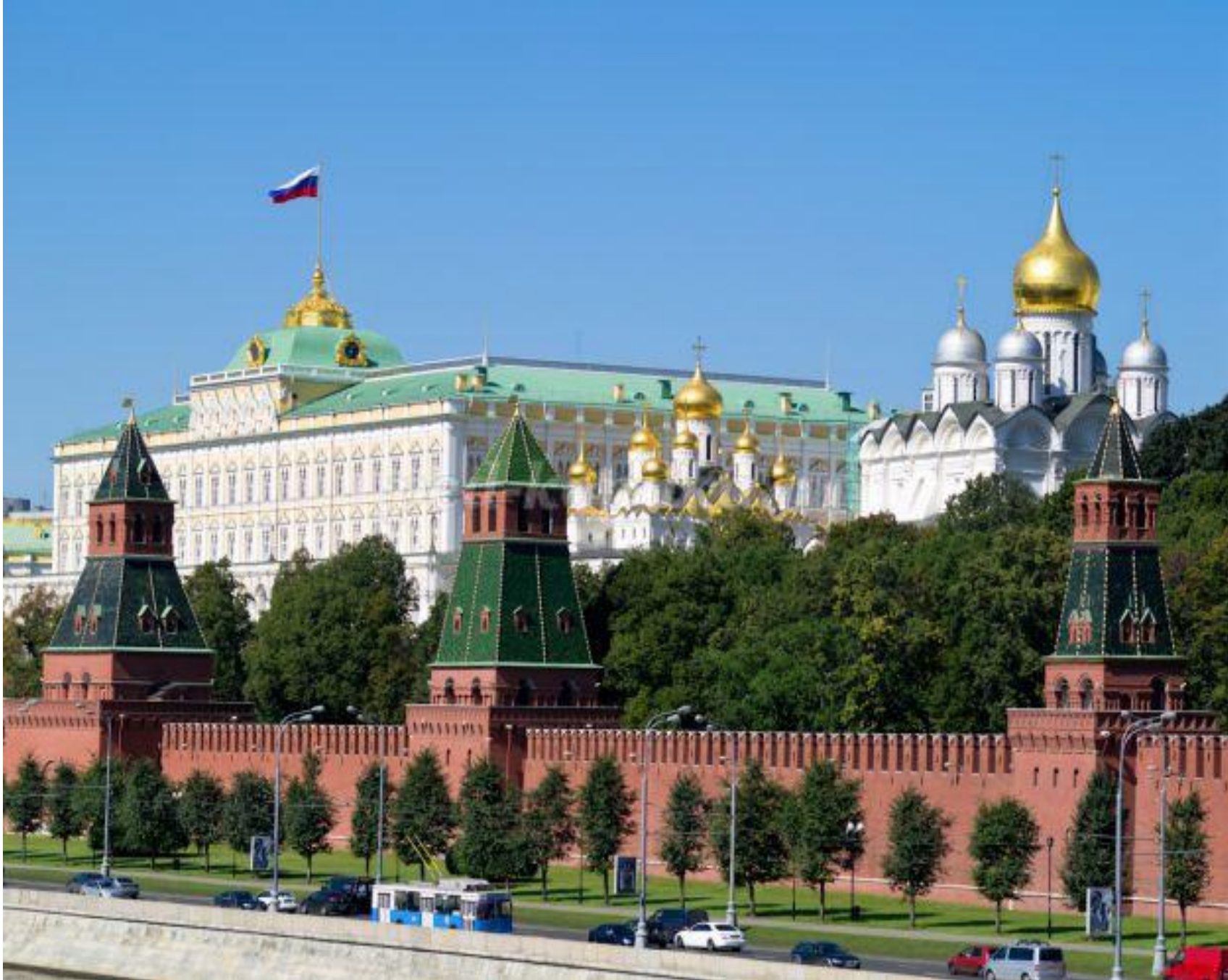
Над Большим Кремлевским дворцом, где находится место работы президента России, всегда, ночью и днем, в любую погоду развивается бело-сине-красный флаг.