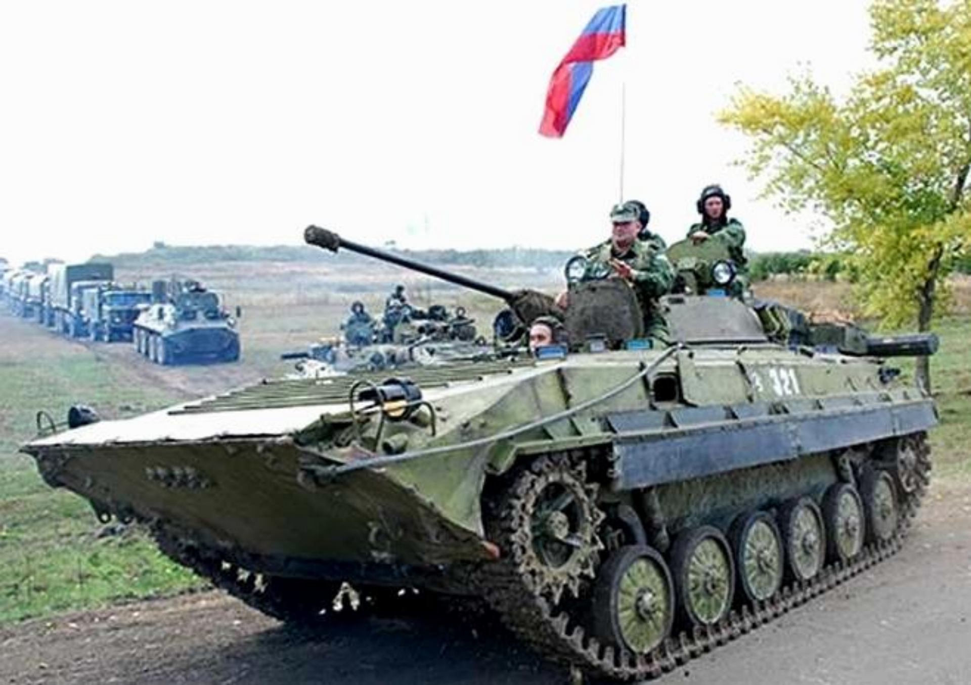
Солдаты всегда шли и идут в бой за Родину под флагом своего государства