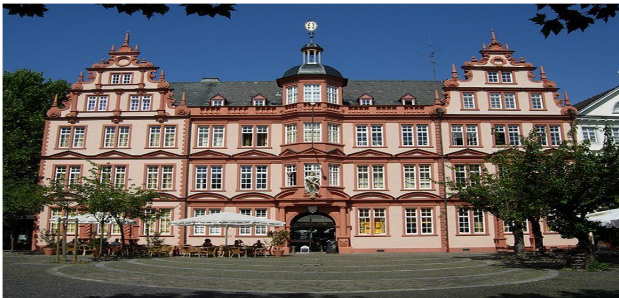
Музей Гутенберга в Майнце. Германия