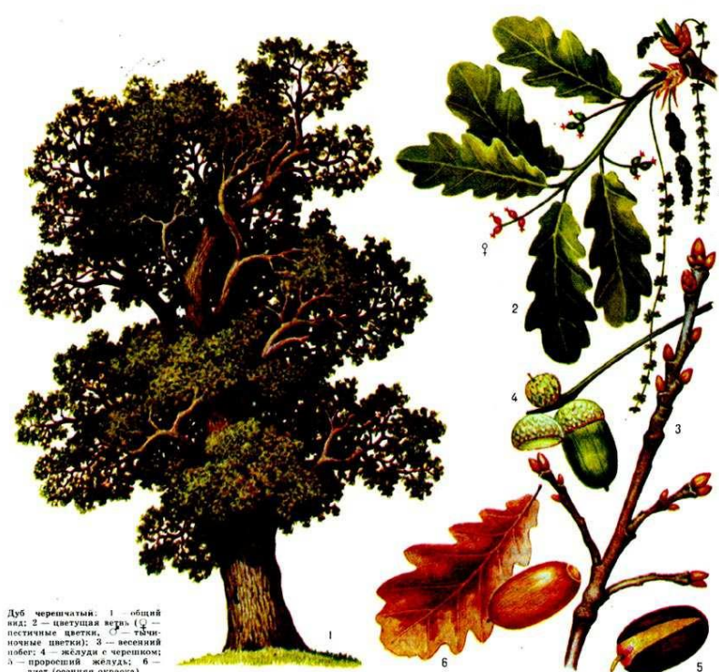
Дуб черешчатый: 1 — общий вид; 2 — двужелудевая ветвь (♀ — пестичные цветки, ♂ — тычиночные цветки); 3 — весенний побег; 4 — желудь с чашечкой; 5 — проросший желудь; 6 — лист (осенняя окраска).