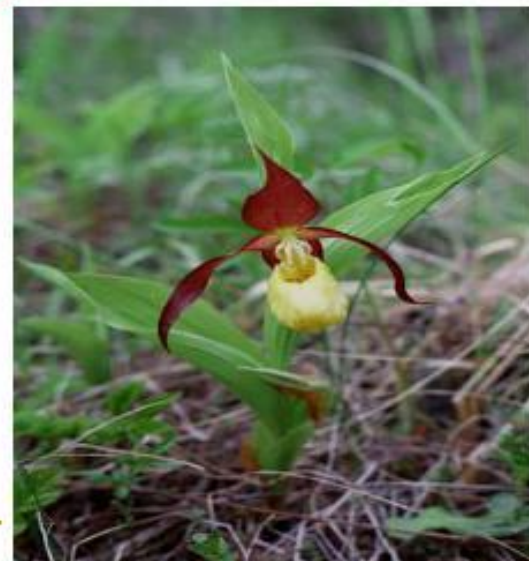
венерин башмачок 🏠