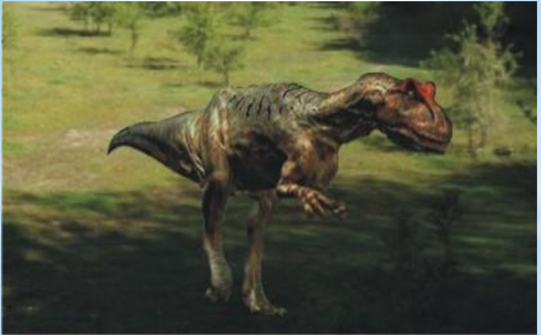
А л л о з а в р