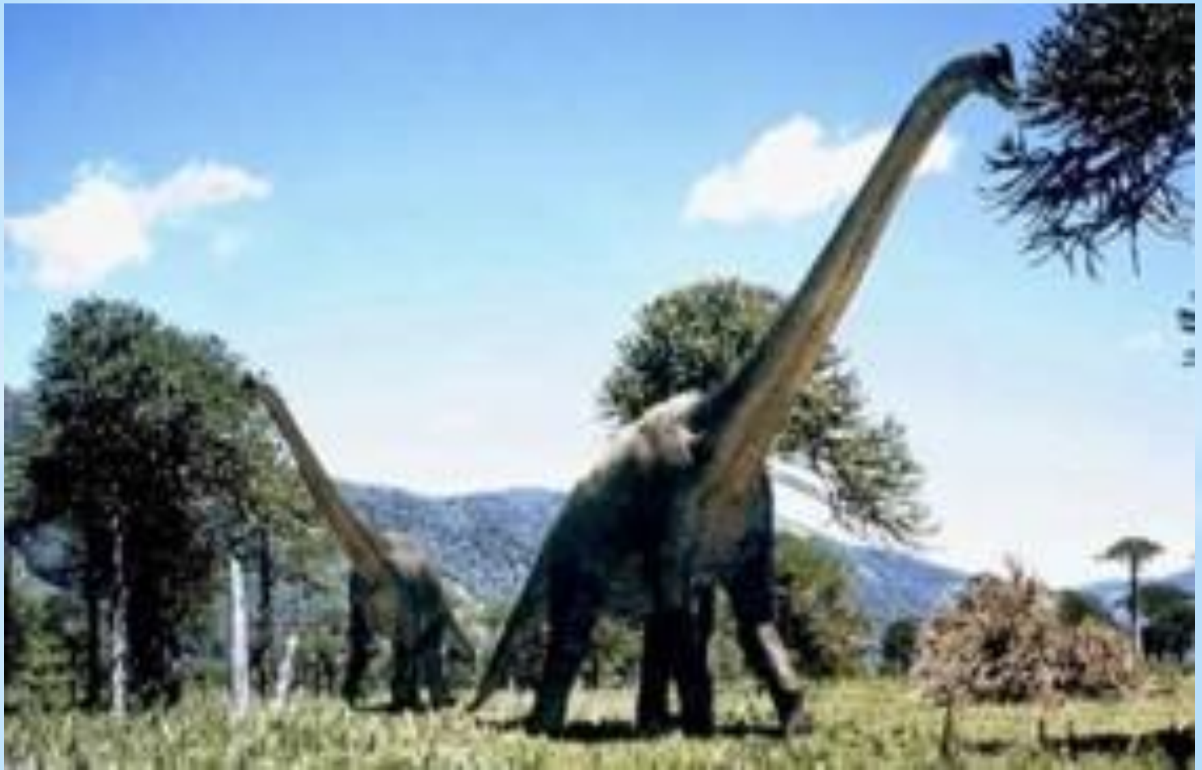
Б р а х и о з а в р