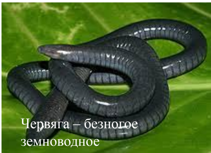
Червяга – безногое земноводное