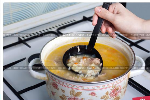
Перемешивание половником мясного супа, готовящегося в кастрюле